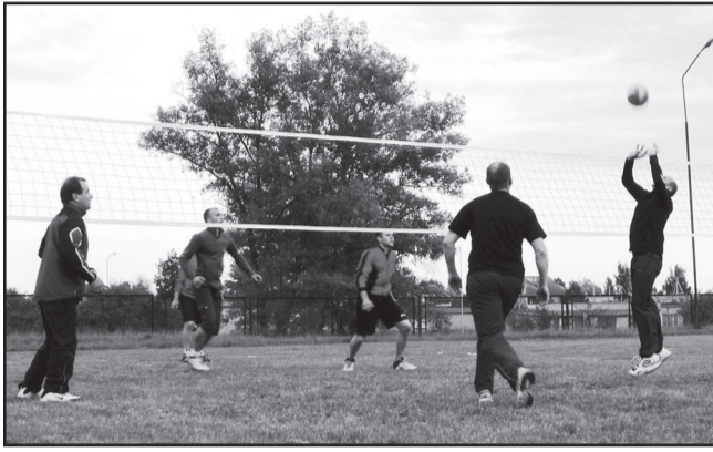
Parko tinklinio vyrų varžybose rungsi net aštuonios komandos

PARKO TINKLINIO 3x3 varžybose dalyvavo 8 vyrų komandos iš skirtingų seniūnijų. Burtų keliu į A grupę pateko Jonišio, Luokesos, Mindūnų, Inturkės komandos, o į B grupę -