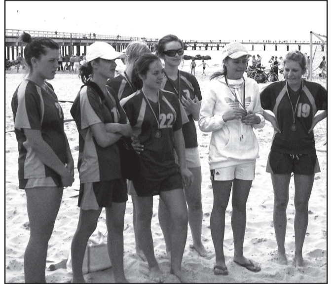
Molėtų tinklininkės užėmė trečią vietą