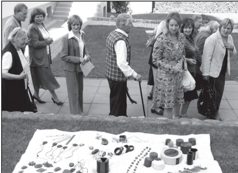
Jaukiame kiemelyje buvo surengta neįgalių žmonių darbų paroda, koncertavo šventės "Pabūkime kartu" nuolatiniai dalyviai Molėtų kultūros centro žmonių su negalia etnografinis ansamblis "Radastėlė"

Šv. Mišios už žmones su negalia, ligonius, jų artimuosius vyko visoje Utenos apskrityje rajonų bažnyčiose, nes dėl sunkmečio buvo at-