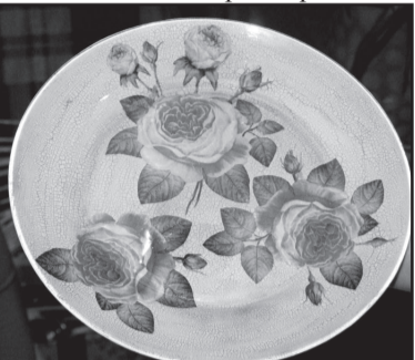
O paprasta lėkštė virto patraukliu kūriniu