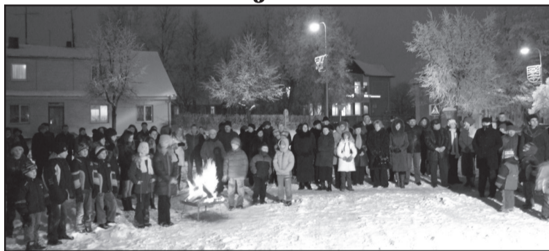
Susiburta prie liepsnojančio laužo Jaunimo aikštėje

-Kas laisvas gimė, tas vergu nebus. Laisvė - pirmasis ir tikrasis tautos laimės ir gerovės šaltinis. Netekti jos - netekti galimybės augti ir tobulėti. Lietuva bus laisva, - 1991 metais Lietuvoje skandavo žmonės. Lietuvių tautos laisvė tuomet išpirkta Lietuvos žmonių gyvybėmis. Lietuvių ryžtą ir pasiaukojimą parodė 1991 m. sausio 13-osios įvykiai. Apie žmonių drąsą tomis dienomis galėjai išgirsti iš pačių dalyvių, spaudos, kitų informacijos priemonių. Tačiau laikas bėgo, nugrimzdo į užmarštį kraupūs vaizdai, apgijo dvasinės ir fizinės žaizdos, liko prisiminimai... Molėtų rajono savivaldybė kasmet juos