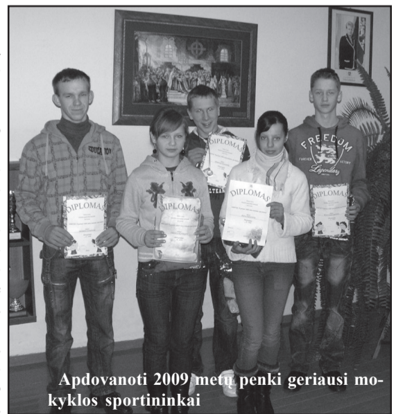
Apdovanojami 2009 metų penki geriausi mokyklos sportininkai