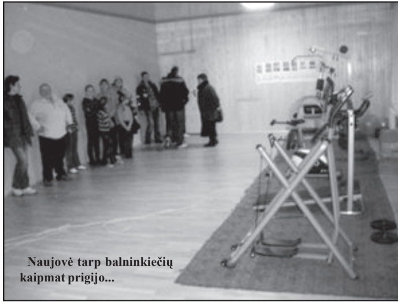
Naujovė tarp balninkiečių kaipmat prigijo...

-Treniruokliai populiarūs ir tarp mokyklinio amžiaus jaunimo, ir tarp septyniadesimtmečių, o kad visi turėtų galimybę sportuoti, yra sudarytas grafikas. Vos tik pastačius treniruoklius pirmąją savaitę norinčių