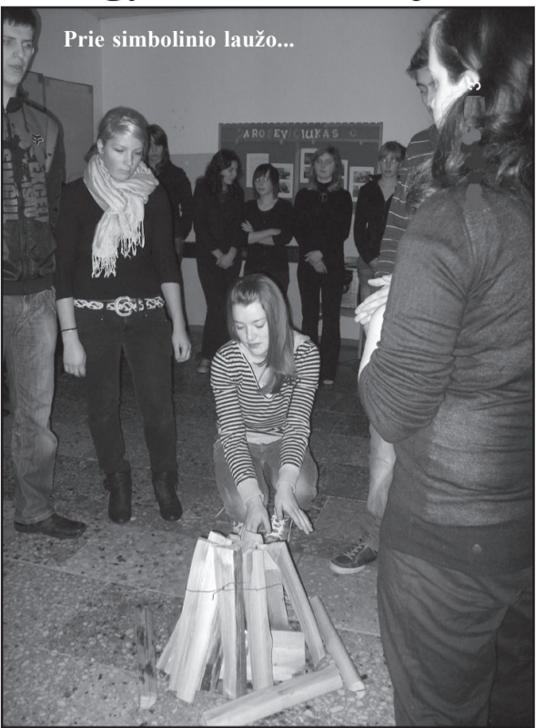
Prie simbolinio laužo...