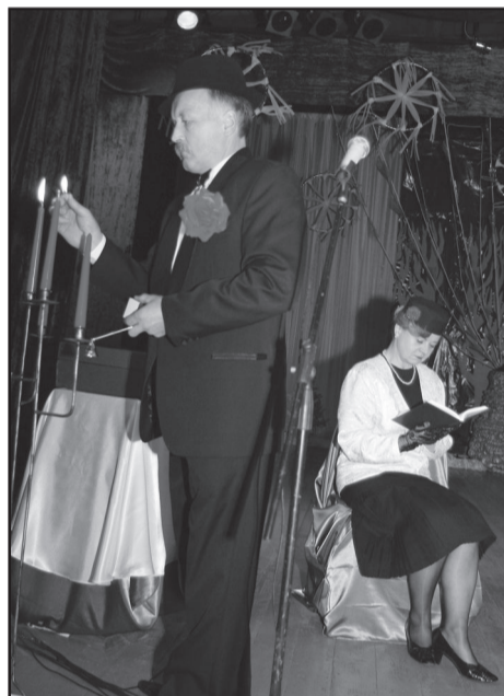
Žiurovui pateikiamas ir mini vaidinimas

tyvo narius tą dieną radome, tačiau smagaus juoko, klegesio ir geros nuotaikos nestigo. Savo veiklos entuziastai pasikeisdami pasakojo, kad "Malkesta" Molėtų rajoną lietuvių liaudies dainomis sūpuoja jau 23 metus. Prasidėjęs nuo nediduko, bibliotekos renginių pertraukėlėms užpildyti skirto aštuonių narių ansambliuko, metams bėgant išaugo į didelį kolektyvą.