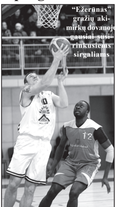
"Ežerūnas" gražių akimirkų dovanoję gausiai susirinkusiems sirgaliams