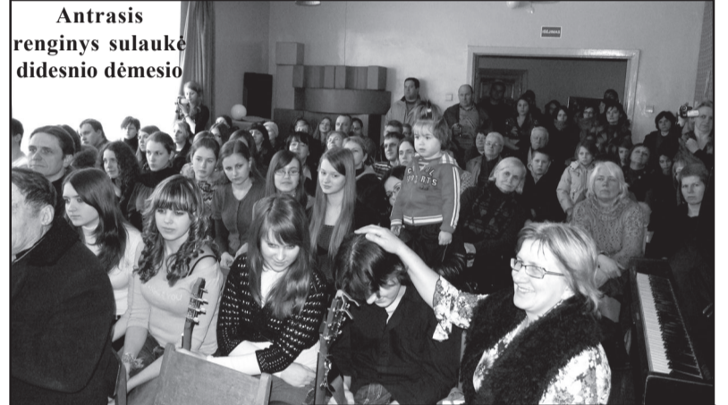
Antrasis renginys sulaukė didesnio dėmesio

Molėtų menų mokyklos salėje įvyko Tėvynės Sąjungos - Lietuvos krikščionių demokratų partijos iniciatyvaus jaunimo pastangomis organizuotas renginys "Dainuoju Lietuvai". Praėjusiais metais daug dėmesio nesulaukęs pirmasis bandymas draugėn suburti kuo daugiau dainuojančio Molėtų rajono jaunimo, šiemet pasiteisino. Renginyje susirinko atstovai iš Alantos, Suginčių vidurinių, Videniškių, Molėtų pagrindinių mokyklų, Molėtų gimnazijos, ir Molėtų menų mokyklos.