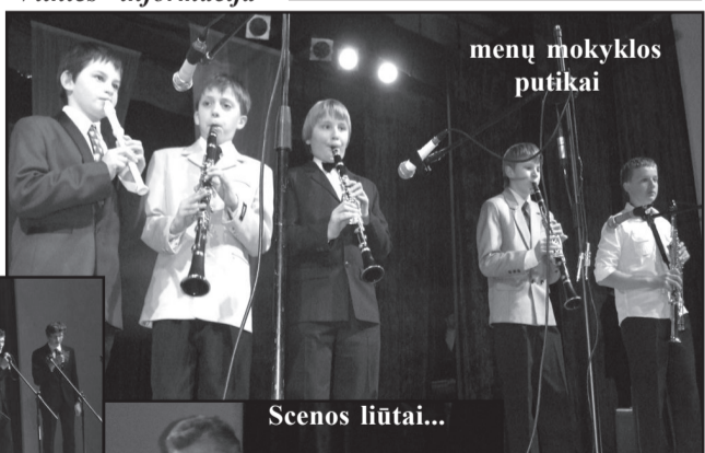
menų mokyklos putikai