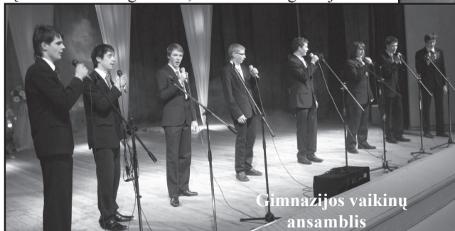
Gimnazijos vaikinų ansamblis

Tarptautinės moters dienos proga dainuojantys Molėtų krašto vyrai visas mylimas moteris pakvietė į renginį "Meilės vardu". Tradicija tapęs koncertas į Molėtų kultūros centro salę kiekvienais metais suburia vis daugiau moterų, kurios daugiau nei valandą gali puikuotis tik joms skiriamu Molėtų muzikantų dėmesiu. Smagu ir tai, kad kasmet gausėja ir dai-