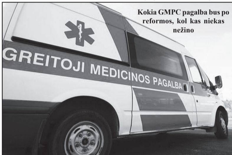
Kokia GMPC pagalba bus po reformos, kol kas niekas nežino