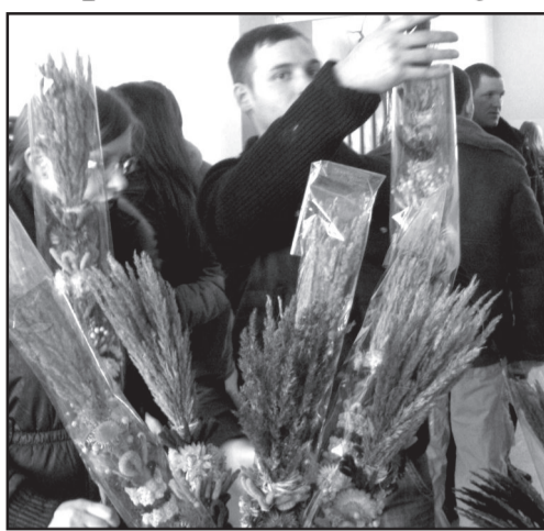
Populiariausias tarp pirkėjų buvo verbos