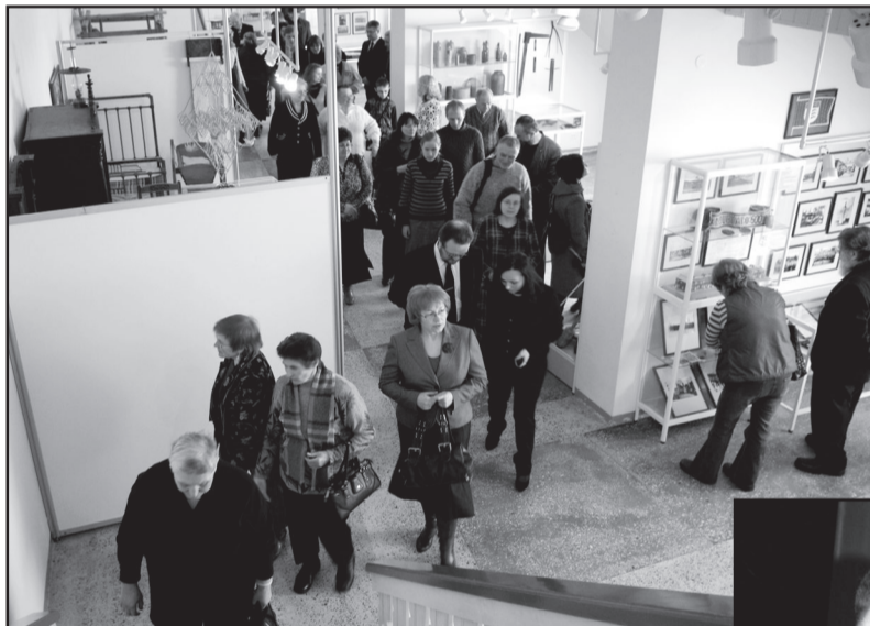
Kiekvienoje krašto muziejaus salėje lankytojų laukė įdomios staigmenos

Šventės meninė dalis taip pat buvo reprezentatyvi, nes mūsų kraš-