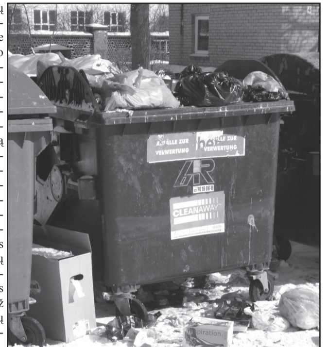
Konteineriai mieste nuolat perpildomi

Dėl buitinių atliekų Molėtų rajone surinkimo bei mokescio už šią paslaugą problemos rajono gyventojai ne kartą kreipėsi į redakciją. Vieni dėstė nepasitenkinimą dėl prasto aptarnavimo, kitus piktina, jų manymu, nepagrįstas mokesčiai už komunalinių atliekų išvežimą. Deja, išklausus į