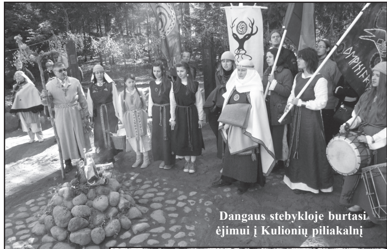
Dangaus stebykloje burtasi ėjimui į Kulionių piliakalnį

nas, ir senas mielai sėdo prie įvairiais juvelyrų įnagiiais nukrauto sta-