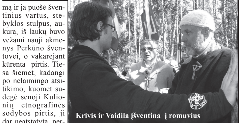
Kravis ir Vaidila iššventina į romuvius

mą ir ja puošė šventinius vartus, stebyklos stulpus, aukurą, iš laukų buvo vežami nauji akmenys Perkūno šventovei, o vakarėjant kūrėnta pirtis. Tiesa šiomet, kadangi po nelaimingo atsitikimo, kuomet sudėgė senoji Kulionių etnografinės sodybos pirtis, ji dar neatstatyta, per-tasi netoliese esančioje kaimynų pirtyje. Tikima, kad visi visatos pradai - ugnis, akmuo, vanduo, oras, garas, medis, žemė teikia dieviškąsias galias dvasiai ir kūniui. Ir tik išsikaitinę,