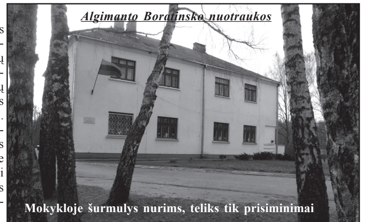
Mokykloje šurmulyks nurims, teliks tik prisiminimai

Molėtų rajono savivaldybės administracijos Kultūros ir švietimo skyriaus vedėjos įsakymu, rajono tarybai įgaliojus, nuo 2010 metų rugsėjo 1 dienos likviduojama Kuolakasių pagrindinė mokykla. Praėjusiais metais 70 metų jubiliejų minėjusioje mokykloje šiemet bus paskutinės išleistuvės, paskutiniai renginiai. Nepaisant to, įėjus į mokyklą, liūdesio nepajusi - pavasariniais mokinių kurtais darbais papuošti mokyklos koridoriai ir klasės, apie įvairius renginius kalbantys nuotraukų pilni stendai liudija, kad mokykloje vyksta aktyvus gyvenimas. Apie mokyklą uždarymą čia kalbama suprantant realią situaciją.