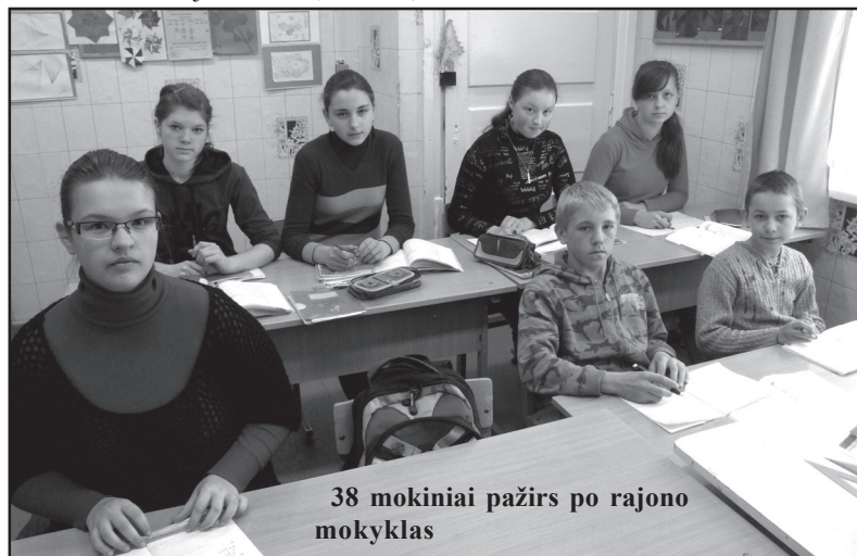
38 mokiniai pažirs po rajono mokyklas

kad mokykla uždaryta, juk čia praleisti patys gražiausi metai. Tai mano pirmoji darbovietė, joje 1977 metais pradėjau dirbti matematikos mokytoja, nuo 1986 m. - direktoriaus pavaduotoja, nuo 1991 m. - Kuolakasių mokyklos direktore. Tad per tiek metų mokykla tapo mano antraisiais namais, o kolektyvas - šeima, - sakė moteris. Nuo kitų metų visi 38 mokiniai pabirs po kitas rajono vidurines, pagrindines ir pradžines mokyklas.