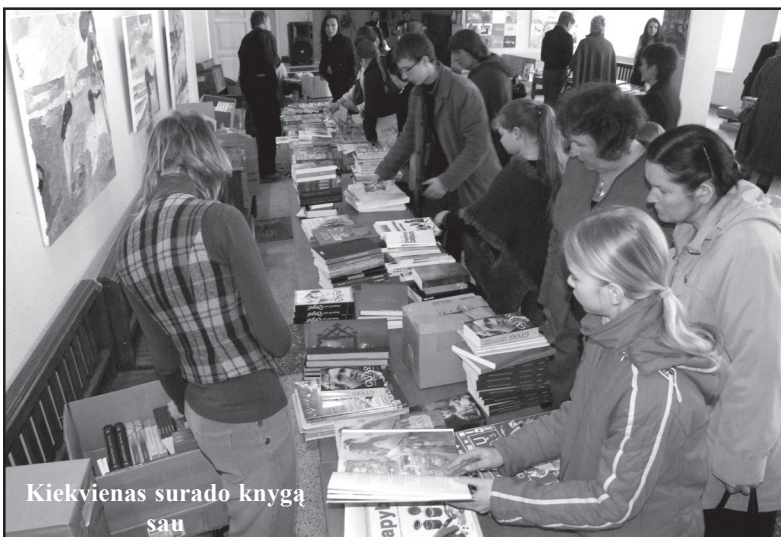
Kiekvienas surado knygą

Praėjusį penktadienį į šaunų ir prasmingą renginį molėtiškius ir miesto svečius pakvietė Mažoji knygų mugė. Kaip ir kasmet, vainikuodami gražų bibliotekų savaitės renginių ciklą, Molėtų viešosios bibliotekos darbuotojai molėtiškiams dovanoja puikius susitikimus su rašytojais, įvairių leidyklų atstovais, kad kiekvienas rastų sau įdomios veiklos ir po šio renginio išeitų šiek tiek dvasiškai užtelėjęs. Mugės atidarymo metu visus susirinkusiuosius gražios knygos šventės proga skambiomis melodijomis sveikino Molė-