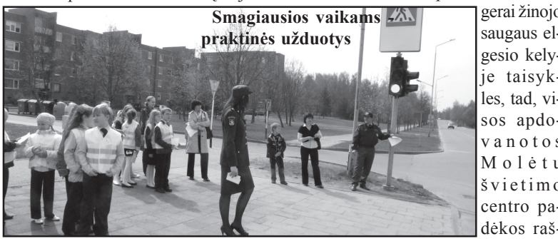
Smagiausias vaikams praktinės užduotys

gerai žinojo saugaus elgesio kelyje taisykles, tad, visos apdovanotos Molėtų švietimo centro padėkos raštais ir maloniomis dovanomis, o pirmųjų vietų nugalėtojai - dar ir diplomais bei taurėmis. Susumavus kiekvieno vaiko atskirai ir visos komandos kartu surinktus balus, paaiškėjo, kad Molėtų pradinės mokyklos komanda užėmė garbingą trečią vietą.