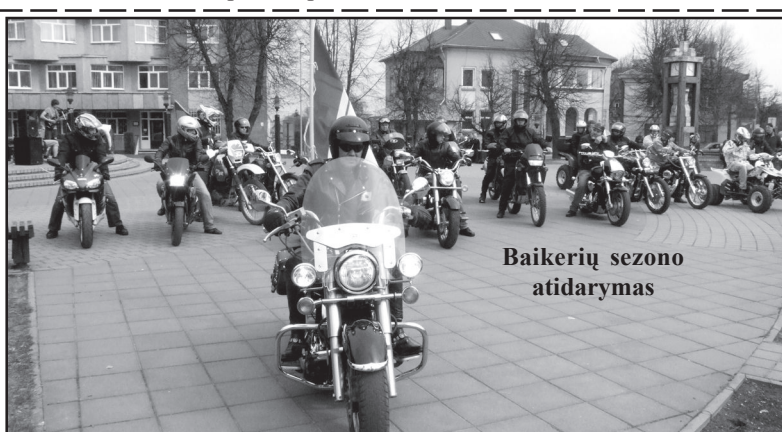
Baikerių sezono atidarymas

šeštadienį ne tik didžiuose miestuose, bet ir Molėtuose jaunimas, tiesa, labai negausiai, rinkosi į "Gatvės (Nukelta į 7 psl.)