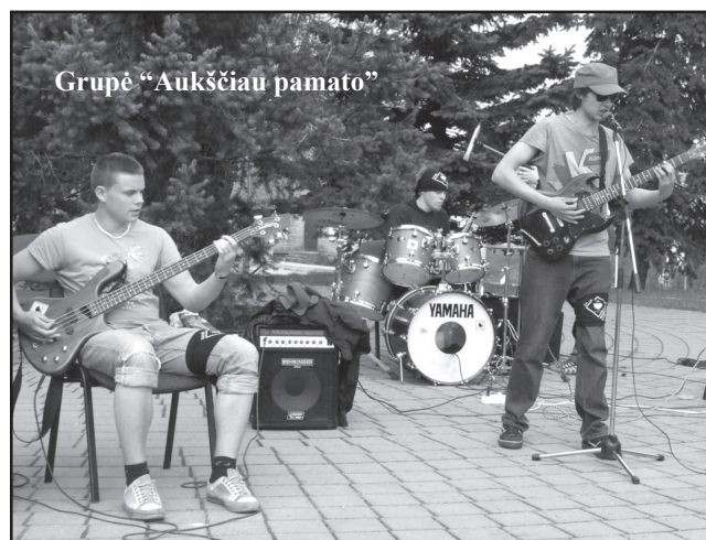
Grupė "Aukščiau pamato"

Jau ketvirtą kartą pirmąjį gegužės šeštadienį Lietuvoje į gatvės muzikuoti išeina tūkstančiai žmonių. Tą dieną visoje Lietuvoje ne tik profesionalūs muzikantai, bet ir mėgėjai išeina į miestų gatves, kiemus, skverus ir aikš-