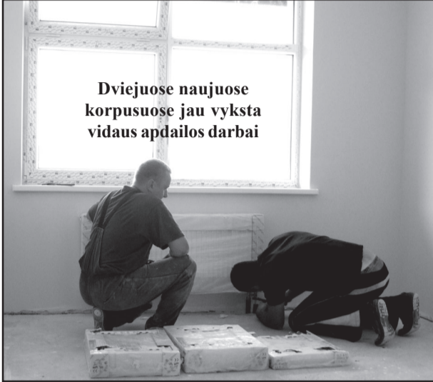
Dviejuose naujuose korpusuose jau vyksta vidaus apdailos darbai

dabartinio pastato. Tad šildymo atžvilgiu išlaidos bus ženkliai mažesnės. Kita vertus, naujas pastatas juk daugelį metų nebus reikalingas remonto. O su persikraustymu dar neskubėsime, nes du korpusus už-