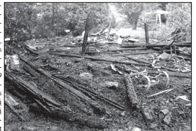
Rugpjūčio mėnesį Parašės kaime kilusio gaisro metu iš ūkinio pastato nebeliko nieko...

loginių ir neekologinių, chemizuotų, ūkių savininkai, nors ir keiksnodami valdžią dėl nepalankių įstatymų, vis dėlto išgyvena. Daug anksčiau ekonominio gyvybingumo kartelę iškelę, modernizavę gamybą ūkių savininkai - gana plačiai žinomi visokių konkursų nugalėtojai - Čereškos, Pusvaškiai, Skebai, Šironai, Gražiai ir visi kiti, tolesniam startui nusiteikę ūkininkai, pajudės dar toliau, kai Lietuva susitars su Briuseliu dėl vieno ar bent vienodesnių paramos sąlygų.