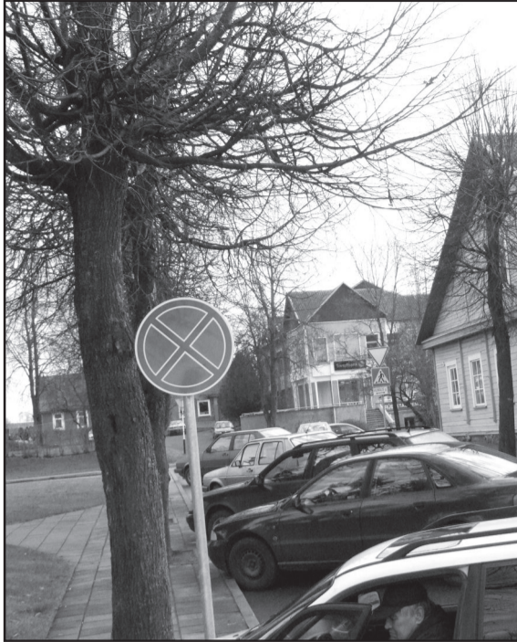
Kol kas draudžiamą ženklo reikalavimą vairuotojai nepaiso...

mobilių stovėjimo aikštelių stygių, pareigūnas dėstė, kad galbūt ši problema bent jau miesto centre išsprendžtų pagaliau įrengus normalią turgavietę. Toje pačioje S. Dariaus ir S. Girėno gatvėje esanti erdvi automobilių stovėjimo aikštelė paversta padėvėtų drabužių prekyviute, antroji automobilių parkavimo aikštelė - taipogi pramoninių prekių prekyviute - netoli esančioje Amatų gatvėje. Pareigūno manymu, Molėtam stinga