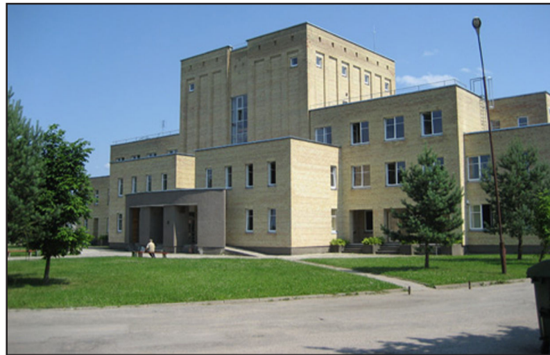
Molėtų ligoninei niekaip nepavyksta išlipti iš milijoninės skolos