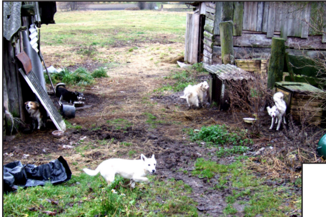
Ką šios sodybos kieme saugo aštuoni šunys?

Spalio 22 dieną drėbtelejo pirmojo sniego, ir Dubingių pašonėje, Miežonių kaime, apsnigtoje ganykloje pastebėta trumpa virve prižiūta karvė sukėlė žmonių gailėstį. Negi jos šeimininkams negaila kankinti gyvulio? Po skambučio į "Vilnius" redakciją ir po žurnalisto kreipimosi į Valstybinę maisto ir veterinarijos tarnybą, pas karvės savininkę atvyko šios tarnybos pareigūnai išsiaiškinti, ar toks karvės ganiavos vaizdelis