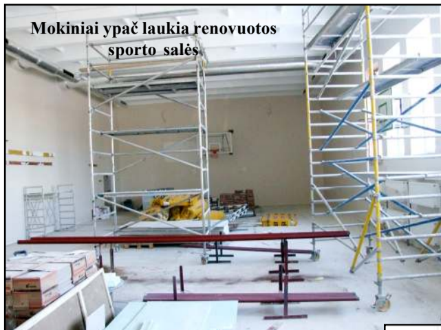
Mokiniai ypač laukia renovuotos sporto salės

tuvės įrangą, - pastebėjo mokyklos direktorė.