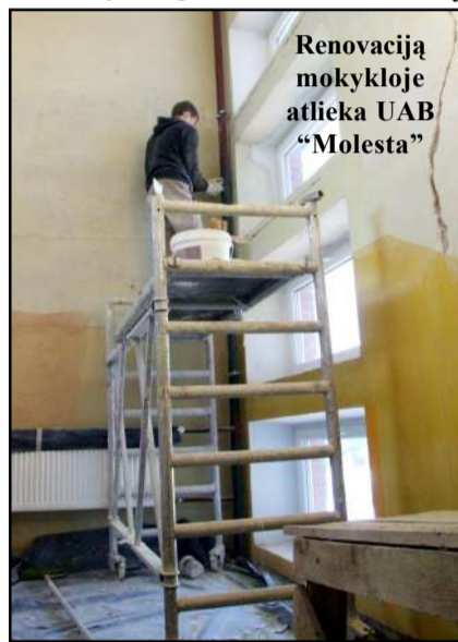
Renovaciją mokykloje atlieka UAB "Molesta"