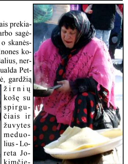
Čigonė būrė likimus... kyta žuvimi prekiaavo UAB "Jūros gėrybių pasaulis"...

O kokia šventė Mindūnuose be gardžios žuvenienės?! Ją šiemet ruošė LNK laidos "Susitikime virtuvėje" kūrybinė komanda. Jie ne tik grožėjosi švente, bet, pasiraioję rankoves, įnirtingai darbavosi iš pradžių prie ekečių, drauge su žvejais bandydami pagauti laimikį žuvienei, o paskiausiai - ir prie (Nukelta į 2 psl.)