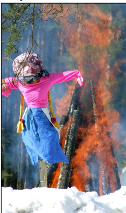
Žiema iš kiemo išvyta didžiuliu laužu ir Morės deginimu