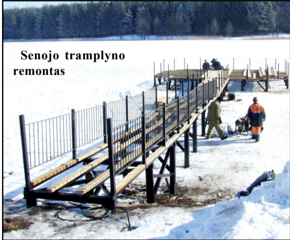
Senojo tramplyno remontas

Jau kuris laikas Pastovio ežere, ties iškyšuliu, molėtiškių vadinamu "rageliu", poledinės žūklės mėgėjai turi užleisti vietą...statybininkams, praėjusiemis tilto per Pastovio ežerą statybos darbus. Projektą "Aktyvaus, gamtą tausojančio turizmo infrastruktūros plėtra Molėtų mieste" vykdančios UAB "Melinga" darbininkai darbus Pastovio ežero pakrantėje - miesto paplūdimyje pradėjo dar rudeni. Įrengiant modernų paplūdimį, pėsčiųjų takus, krepšinio, tinklinio, vaikų žaidimų aikštes ir kt., dar iki prasidedant darbus sustabdžiusiam sniegui ir šalčiui, buvo nemažai padaryta. Jau žiemos metu buvo sukalti poliai būsima baidarių prieklaikai bei lieptui, kuris įrengiamas vietovės buvusio senojo taip vadinto "tramplyno". Šio liepto statybos darbai jau artėja prie pabaigos, kadangi šiuo metu jau dedamas jo paklotas. O šią savaitę melingiečiai užbaigs vieną iš darbų etapų didžiojo pėsčiųjų tilto per Pastovį statyboje. Šią