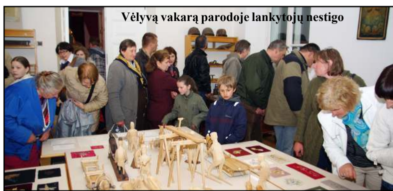
Vėlyvą vakarą parodoje lankytojų nestigo

Prabangiais senoviais drabužiais apsiredę anykštėnai susirinkusiems dovanojo senovinių šokių programą, kuri abejingų nepaliko. Vėliau visi rinkosi į Alantos dvaro salę, kurioje buvo oficialiai atidarytos dvi parodos. Apie parodą iš VDA tekstilės katedros fondų "XVII - XIX a. siuvinėjimo kopijos" kalbėjo Alan-