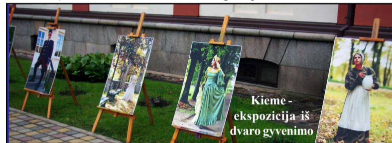
Kiemo - ekspozicija iš dvaro gyvenimo

P.S. Panašu, kad jau tampa tenden- cija koreguoti renginio scenarijų, kuomet į rajono renginius atvyksta TV žurnalistai. Organizatorių dėmesys sutelkiamas ties televizijos kameromis... Tad Alantos dvare dėl televizinių renginio pradžios, merkiant lietuvių, žiū-