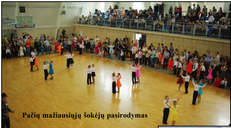
Pačių mažiausiųjų šokėjų pasirodymas