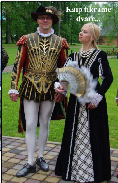
Kaip tikrame dvare...