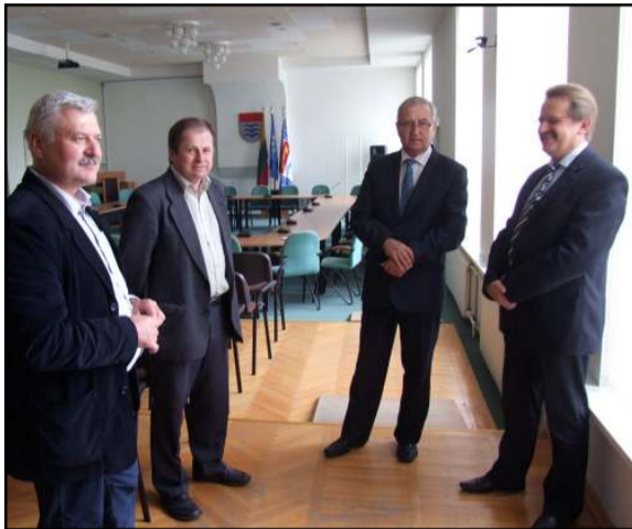
Komisija norinčiųjų dalyvauti egzamine nesulaukė