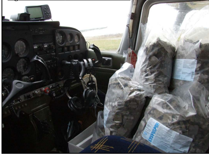
Pagal planą aviatoriai turėjo išmėtyti apie 140 tūkstančių vakcinų nuo pasiutligės jaukų