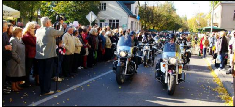
Be "Molmoto" parado neapsieina nei vienas didesnis rajono renginys