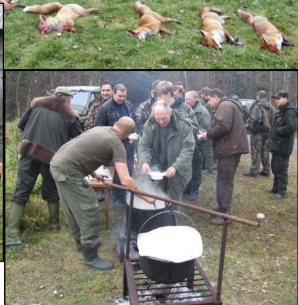
Išsirikiuota prie tradicinio medžioklės viralo Poviliškio medžiotojų klubo medžioklės ragų muzikos ansamblis. "Vilnius" informacija

mingų šūvių autoriai. O šventinės medžioklės, kurioje dalyvavo daugiau negu 100 medžiotojų, karaliumi tituluo-