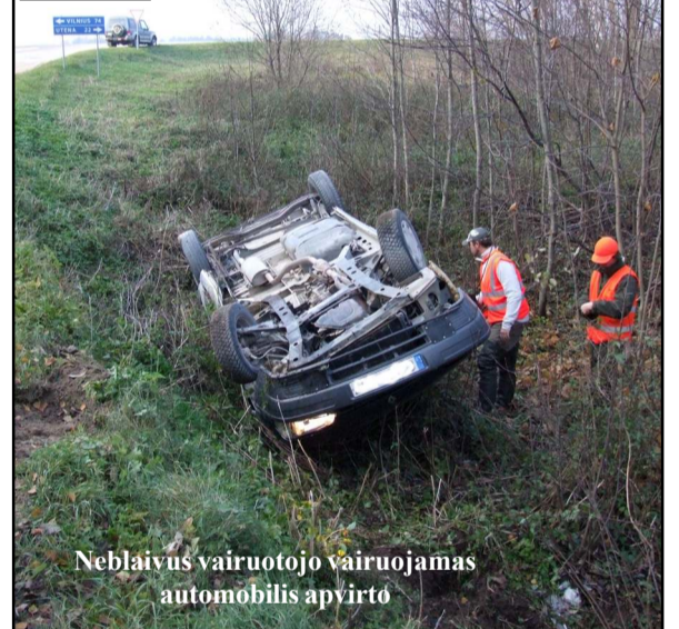
Neblaivus vairuotojo vairuojamas automobilis apvirto