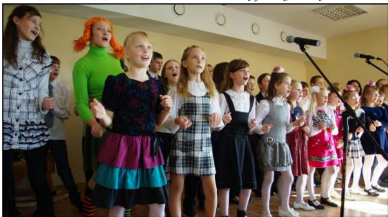
Naujakurių dovana svečiams - puikus koncertas