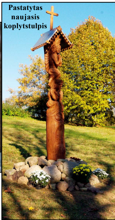
Pastatytas naujasis koplytstulpis

visiems, palaikiusiems ir padėjusiems įgyvendinti šią idėją, pakvietė pabūti prie senų papročiu užkurto laužo, pasidalinti prisiminimais, išgerti puodelį karštos arbatos. Manau, tai mūsų pareiga pasirūpinti, kad laikas neužneštų šios šventos