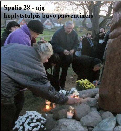
Spalio 28 - ają koplytstulpis buvo pašventintas

visiems, palaikiusiems ir padėjusiems įgyvendinti šią idėją, pakvietė pabūti prie senų papročiu užkurto laužo, pasidalinti prisiminimais, išgerti puodelį karštos arbatos. Manau, tai mūsų pareiga pasirūpinti, kad laikas neužneštų šios šventos