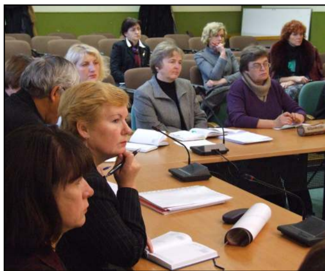
Aktuali diskusija vyko savivaldybės salėje