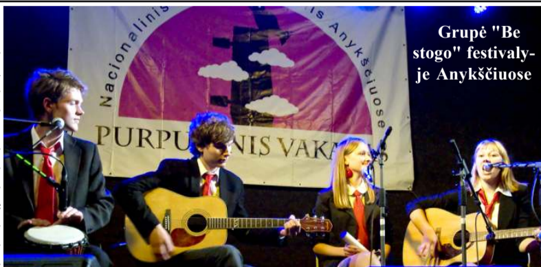
Grupė "Be stogo" festivalyje Anykščiūose