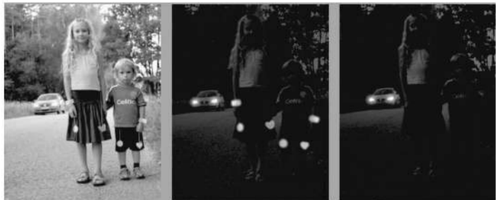
Su atšvaitais dieną