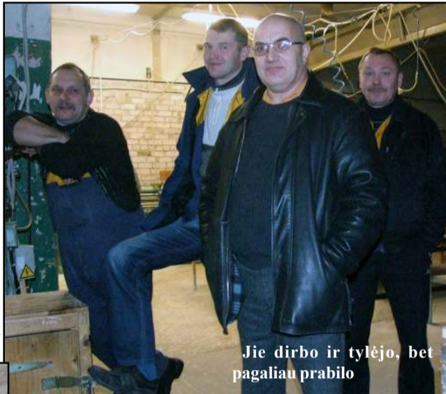
Jie dirbo ir tylėjo, bet pagaliau prabilo

Atsakymą pasiūlo žmogiškoji patirtis: apie mirusiuosius - tik gerai arba nieko. Apie kryptantį saulėlydžio link mūsų rajono medienos apdirbimo gigantą - UAB "Sodo namas" - taip pat derėtų kalbėti tik gerai ar bent pagarbiai. Prieš tryliką metų į Videniškiuose įkurtą modernią įmonę pačiais geriausiais metais suplūdo iš mūsų ir kaimyninių rajonų kaimų, miestelių ir Molėtų miesto daugiau nei pusė tūkstančio darbininkų (anuomet rašėme, jog pasiektas rekordinis skaičius - 560). Todėl investuoti į sukuriamas jiems darbo vietas, garantuoti stabilų uždarbį, laiku atsiskaityti su tiekėjais ir valstybės institucijomis verslui buvo didelis iššūkis, nes bendrame medienos rinkos fone geros žinios keisdavosi vietomis su blogomis. "Sodo namas" kurį laiką atlaikė ne tik rinkos spaudimą, bet ir 2008 metais patirto didžiulio