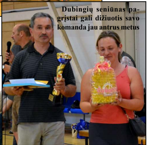
Dubingių seniūnas pagristai gali dižiuoti savo komanda jau antrus metus