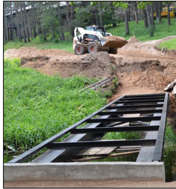
Vasaros estradą per pusę "skeliantį" upelį papuoš dar vienas pėsčiųjų tiltas

tarp suolų eilių įrengiami laiptai, iškloti trinkelėmis. Numatyti trys ilgieji ir du trumpieji laiptų konstruktyvai. Greta senojo tiltelio, kitoje pusėje jau pastatytos antrojo tilto konstrukcijos, baigiama asfalto danga