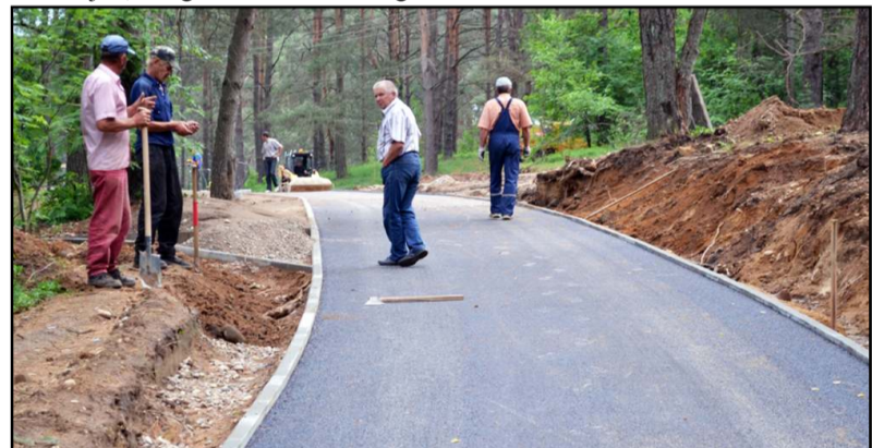
Buvę miško brūžynai ir sunkiai lengvuju automobiliu įveikiamas šunkelis po truputį virsta asfaltuota gatve

Dėl užsitęsusių šiųmetės žiemos pagal projektą "Molėtų rajono Kanapelkos kaimo poilsio ir kultūros