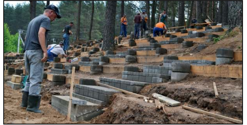
Renginių žiūrovams kuriama nauja erdvė su maumedžio suolais ir trinkelėmis grįstais takais bei laiptais

- Įrengiamos žiūrovams skirtos vietos - jau yra gręžtiniai suolų pamatai, patys suolai bus padaryti iš maumedžio. Iš viso numatyta įrengti 416 sėdimų vietų. Patogu bus ir nusileisti nuo žiūrovų tribūnos, nes