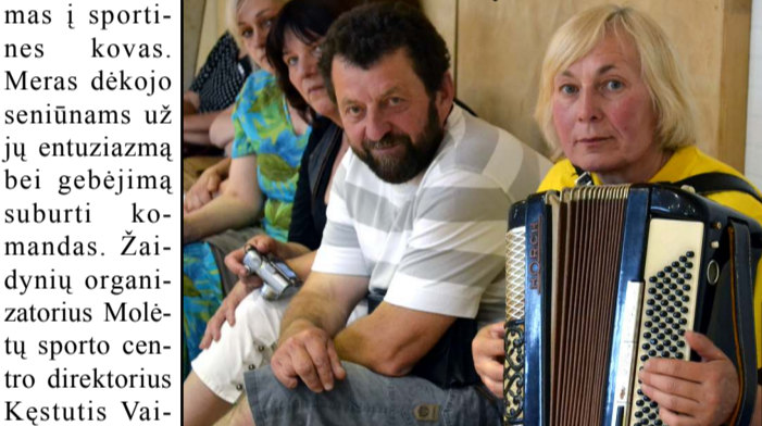
Varžytasi ir akordeonu...