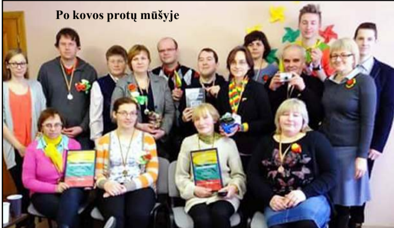
Po kovos protų mūšyje