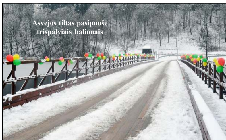
Asvejos tiltas pasipuošė trispalviais balionais