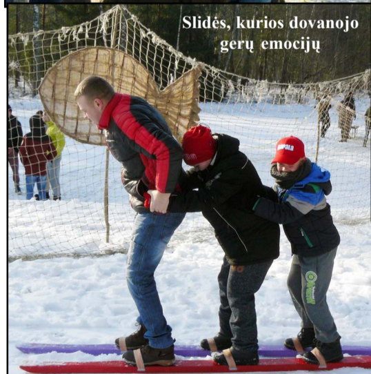
Slidės, kurios dovanuoja gerų emocijų