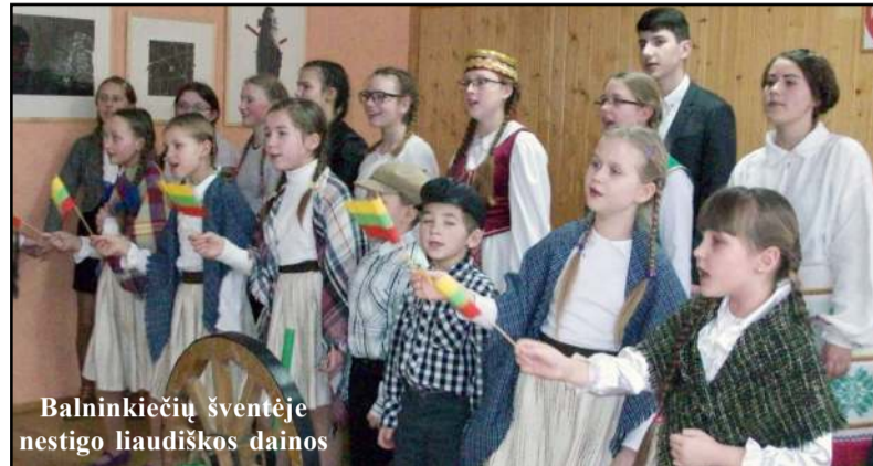
Balninkiečių šventėje nestigo liaudiškos dainos