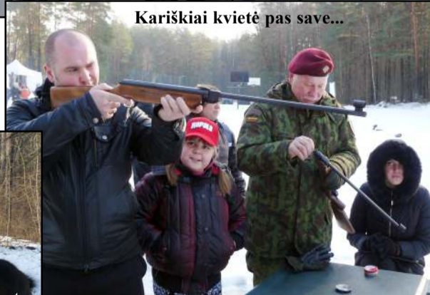
Kariškiai kvietė pas save...