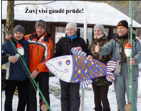
Žuvį visi gaudė prūdė!