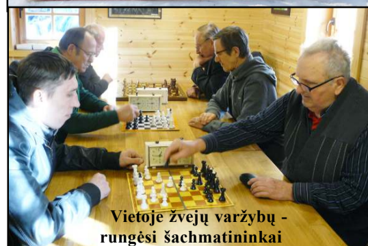
Vietoje žvejų varžybų - rungėsi šachmatininkai