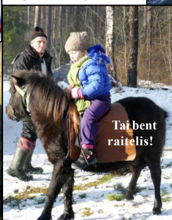
Tai bent raitelis!