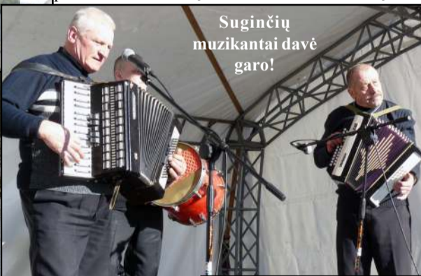
Suginčių muzikantai davė garo!