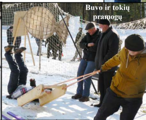
Buvo ir tokių pramogų