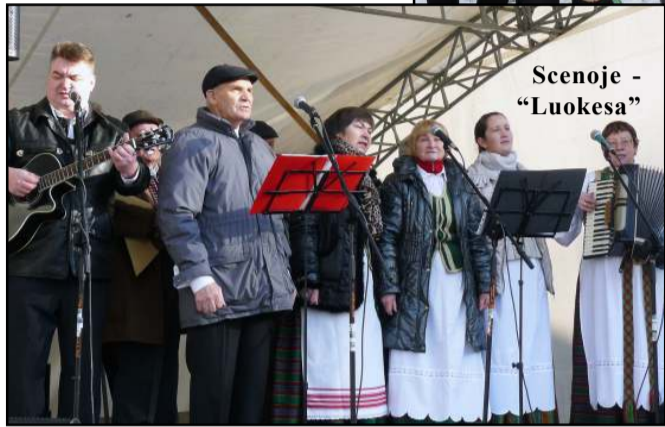
Scenoje - "Luokesa"