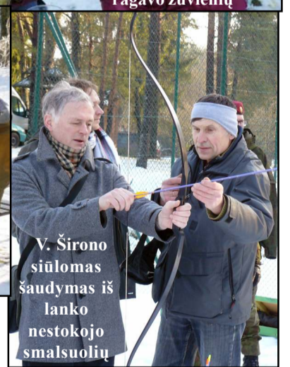
V. Širono siūlomas šaudymas iš lanko nestokojo smalsuolių