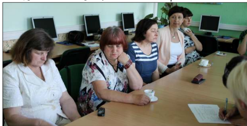
Susitikime akcentuota, kad norinčiųjų globoti vaikus stinga