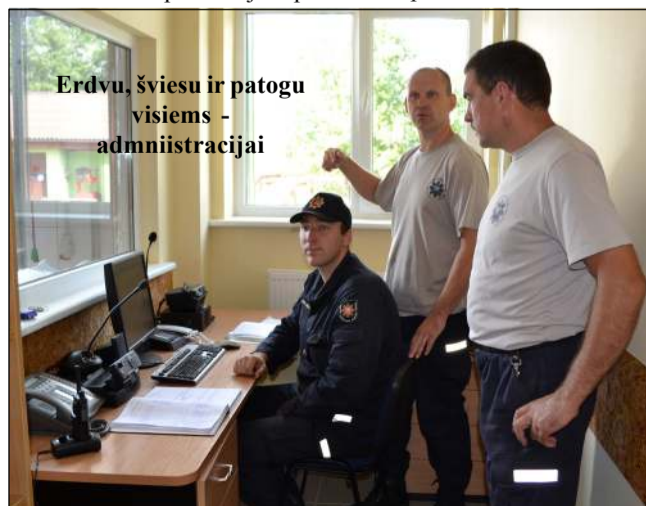
Erdvu, šviesu ir patogiu visiems - administracijai