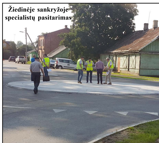
Žiedinėje sankryžoje specialistų pasitarimas

DAR GALITE užsiprenumeruoti savo krašto laikraštį "Vilnis" rugsėjo mėnesiui! NIEKO NAUJO NEŽADAME - TIK savo krašto naujienas ir aktualijas, tikrą mūsų gyvenimą. DRAUGAUKIME!