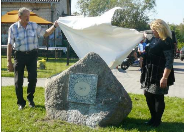
Atidengtas paminklinis akmuo