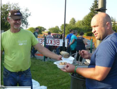
Kareiviška košė buvo populiari