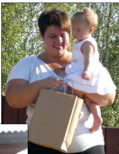
Dėmesio sulaukė jauniausia bekupietė

- Tai, be abejonės, vienas geriausių ir veikliausių bendruomenės centrų rajone. Kas, kad keičiasi pirmininkai - tas