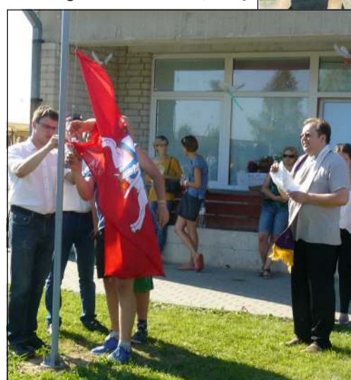
Iškilmingas atidarymas - vėliavos pakėlimu

gimtadienį atvyko nemažai kraštiečių, kurie sugrįžo, kad aplankytų tėviškę, kad pavaikšiotų savo senelių, tėvų numintais takeliais, susitiktų, pasilabintų, pasidžiaugtų vieni kitais. Atidengtą paminklinį akmenį palydėjo šventinės salvės - už Lietuvą, už Bekupę, už į renginį susirinkusius... R. Kildišienė pasidžiaugė, kad sugrįžta į gimtinę vis daugiau žmonių, kvietė visus savanoriškais darbais prisidėti prie gražių iniciatyvų, žmonių taurinimo. Is-