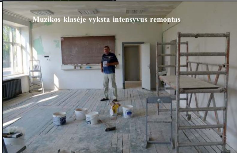
Muzikos klasėje vyksta intensyvus remontas