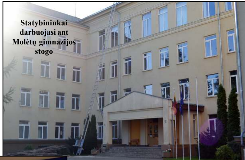
Statybininkai darbuojasi ant Molėtų gimnazijos stogo