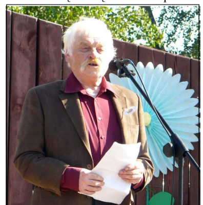
Ieškota istorinių šaknų...