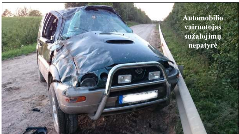
Automobilio vairuotojas sužalojimų nepatyrė