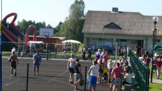
Sportinės aistros virė krepšinio ir tinklinio aikštėse