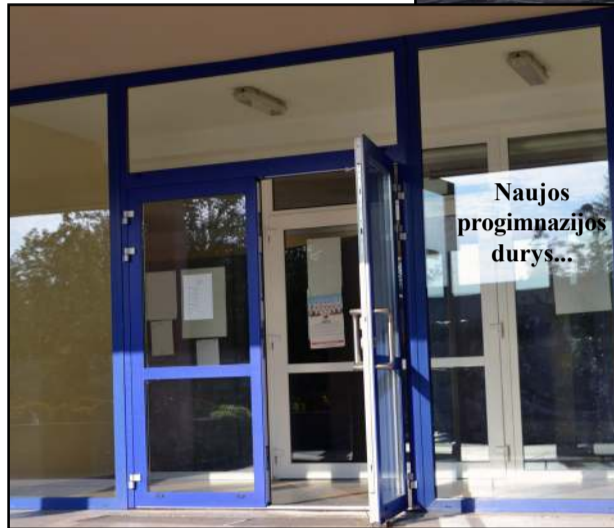
Naujos progimnazijos durys...

atliktas sporto salės grindų lakavimas ir kiti smulkesni darbai.