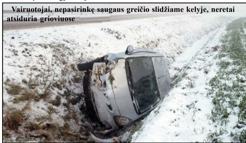
Vairuotojai, nepasirinkę saugaus greičio slidžiam kelyje, neretai atsiduria grioviuose

ras, kurį policijos pareigūnai rado ir namo parvežė. Kavinės "Eglutė" barmenė pranešė, kad neblaivus vyras apšlapino kavinės sieną. Kaip vėliau paaiškėjo, taip pasielgta po konflikto dėl neveikusio san. mazgo. Gilučių kaime neblaivus tėvas užsirakino namuose ir sūnaus neįsileido, kol policijos pareigūnai neatvyko. Kreiviškių kaime išgėręs pranešėjas skundėsi, kad jį sūnus ir žmona muša. Toliučių kaime netoli parduotuvės muštynės dėl alkoholio vyko, tačiau labai greitai vietoje išsisprendė. Videniškių kaime automobilio "PEUGEOT" vairuotojas nepasirinko saugaus greičio, nesuvaldė automobilio ir trenkėsi į kelio atitvarus.