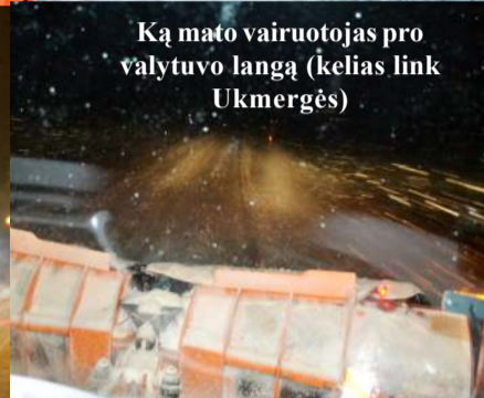
Ką mato vairuotojas pro valytuvo langą (kelias link Ukmergės)