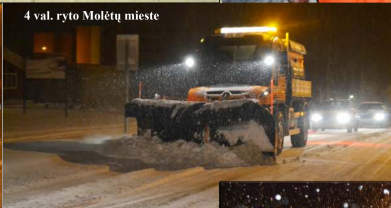
4 val. ryto Molėtų mieste