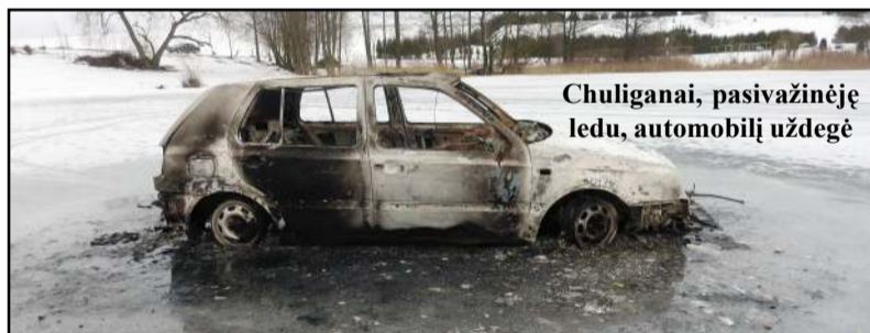
Chuliganai, pasivažinėję ledu, automobilį uždegė

Pasak pareigūno, vietos gyventojai priklausanti pirtis buvo pastatyta konstruktyvui naudojant metalą. Pirties išorinės sienos buvo apkalotos skarda, apšiltintos akmens vata, vidaus sienos apkalotos medinėmis