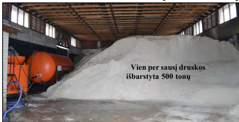
Vien per sausį druskos išbarstyta 500 tonų

-Ši žiema tikrai neleidžia apie save pamiršti. Sausį druskos - smėlio mišinio prireikė daugiau dėl to, kad pagal nuo sausio 1 dienos pasikeitusią kelių priežiūros žiemą tvarką keturių rajoninių kelių atkarpos, prižiūrimos pagal II priežiūros lygį, tai yra, ne tik valomos, bet ir barstomos, - kalbėjo