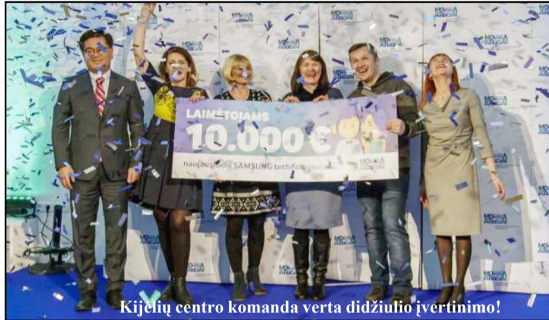
Kijėlių centro komanda verta didžiulio įvertinimo!

Labiausiai motyvuotais ir pažangiausiai mokytojais Lietuvoje šiemet tapo Molėtu r. Kijėlių specialaus ugdymo centro pedagogai. Šį verdiktą paskelbė pirmadienį Vilniuje vykusio finalinio skaitmeninių mokymų pedagogams programos "Samsung Mokykla ateičiai"