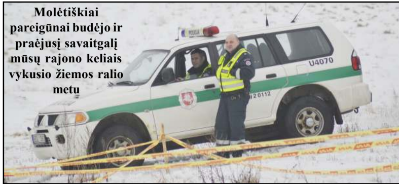
Molėtiškiai pareigūnai budėjo ir praėjusį savaitgalį mūsų rajono keliais vykusio žiemos ralio metu

matyti vyrai beldėsi, išsigandusi moteris policijos pareigūnus iškvietė, bet nuvykę jie jau nieko nerado. Iš Molėtų savivaldybės skambinta, kai WC užsirakino ir išeiti nenorėjo asocialus asmuo, tačiau, kol policija atvyko, vyras jau buvo pasišalinęs. Iš Alantos gautas pranešimas apie keitinimą išprievartauti, tačiau, kaip vėliau paaiškėjo, gerokai neblaivi mergina pati gėrė su dviem vaikiniais, vienas kurių jai tik pasiūlė kartu su juo į lovą atsigulti, o ji išsiveidusi policijos pareigūnus iškvietė ir ji melagingai nebūtais dalykais kaltino. Kelyje Vilnius - Utena ties Suginčiais etatinis "pijokėlis" su dviračiu po automobilio ratais pasimaišė ir dar bėgti bandė, tačiau vairuotojas jį sustabdė ir pareigūnus iškvietė. Šeikiškės viensėdyje dėl slidžios kelio dangos automobilis "TOYOTA" nuo kelio nuvažiavo, tačiau žala niekam nepadaryta, tad ir pretenzijų vairuotojas neturėjo. Dienavagių kaime mama su sūnumi susipyko. J.Janonio gatvėje jaunimas alkoholio nepasidalino, susipyko, apsistumdė ir vienas kitą vagyste apkaltinę policijos pareigūnus iškvietė. Iš Pušalotų kaimo gautas pranešimas, kad moteriai nutraukta koja, nuvykę į vietą policijos pareigūnai ir medikai iš tiesų rado moterį su atviru kojos kaulo lūžiu. 1954m. gimusi moteris namo kiemu eidama užkliuvo už kibiro ir visu svoriu griuvo taip, kad lūžo kojos kaulas. Iš Liepų gatvės skambinusi moteris skundėsi, kad galimai