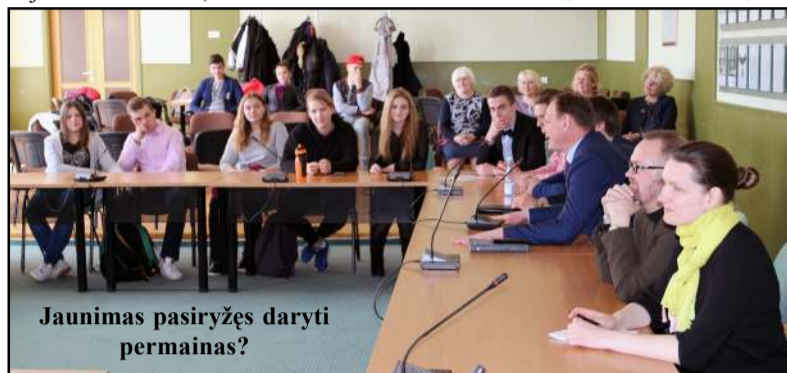
Jaunimas pasiryžęs daryti permainas?

vanoriškais pagrindais. Taipogi pasiūlyta, pasinaudojus Molėtų gimnazijos pavyzdžiu, kuomet vykdyta iniciatyva "Obuolio diena", kuri buvo įvertinta jau ir respublikos lygiu, Molėtų miesto šventės metu surengti akciją "Valgyk obuolį Molėtų". Gimnazijos mokinių tarybos pirmininkas ir rajono mokinių tarybos