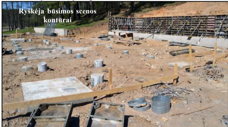
Ryskėja būsimos scenos kontūrai

darbus planuojama užbaigti iki birželio pabaigos... Kol vyksta scenos rekonstrukcija, darbų pabaigos lū-