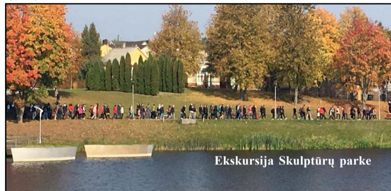
Ekskursija Skulptūrų parke

gioninio parko direkcijose. Šiandien iš viso Molėtų rajone gido paslaugas teikia šeši asmenys, kurie su siūlyta programa ar anksčiau įgiję reikiamus sertifikatus. Su kai kuriais iš