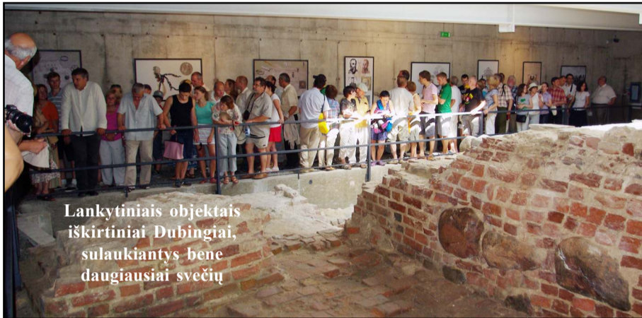
Lankytiniais objektais išskirtiniai Dubingiai, sulaukiantys bene daugiausiai svečių

ziuoja vilniečiai, tačiau taip pat atvyksta ir žmonės iš visos Lietuvos. Kelių valandų ekskursijas po Dubingius užsisako žmonės ir šeimos, nes čia apžiūrėję įdomius objektus vėliau žmonės gali apsilankyti Dubingių žirgyne ir pavalgyti. Apskritai reikia pastebėti, kad lietuviai noriai keliauja po savo šalį ir tai daro visais metų laikais, nebijodami blogo