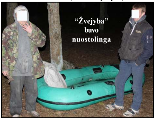
"Vilnius" informacija ninkai, vėliau ištraukę devynis tinklus. (Nukelta į 6 psl.)

Molėtiškiai aplinkosaugininkai praėjusią savaitę surengė reidą žuvų ištekliams apsaugoti, Spenglo ežere sulaikė du etatinius pažeidėjus. Reido metu vakarop pareigūnai pastebėjo nuo kranto išplaukiančią valtį, kurioje buvę du vyrai pradėjo statyti tinklus. Jau sutemus vyrai grįžo į krantą, kur jų jau lūkuriavo aplinkosaugi-