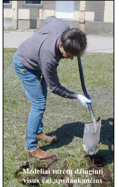
Medeliai turėtų džiuginti visus čai apsilankančius

Praėjusį penktadienį gražinti ir papuošti įstaigos aplinką tradiciškai išsirušė VŠĮ Molėtų ligoninės kolektyvas, kuriems sėkmingai ir žaismingai talkino kai kurių gydytojų atžalos. Kaip sakė ligoninės vadovas Vaido-