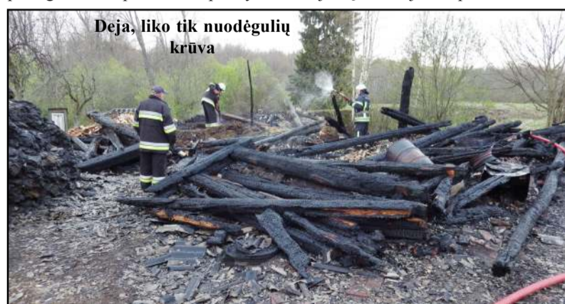
Deja, liko tik nuodėgulių krūva

nį pastatą - tvartą... Nelaimėi, šeimninko namuose nebuvo, o gaisras buvo pastebėtas bei pagalba kvies-ta jau įsisiautėjus liepsnoms. Gais-