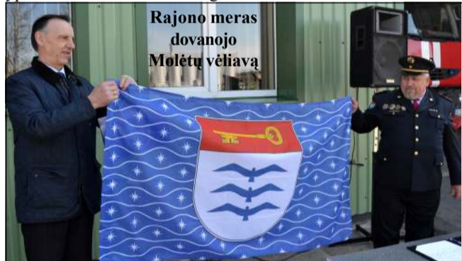
Rajono meras dovanuoja Molėtų vėliavą