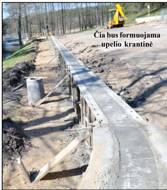
Čia bus formuojama upelio krantinė