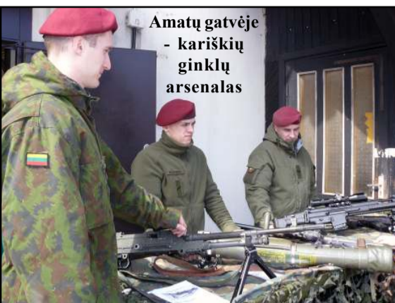
Amatų gatvėje - kariškių ginklų arsenalas