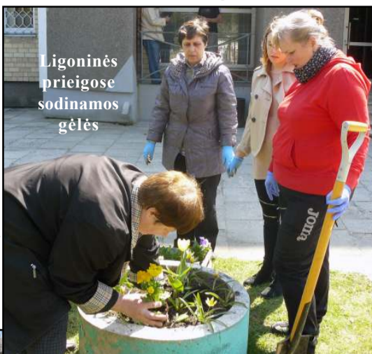
Ligoninės priegose sodinamos gėlės

pasidžiaugdami, kad į klombas kasmet pilamos geros žemės leidžia gėlėms vešėti, pasodinta medelių, taip pat pamirėta, kad po kelių savaitių čia pat rasis ir vasarinių gėlių. "Prieš kelerius metus įstaigos priegose buvome rožyną pasodinę, tačiau, deja, ilgą laiką tuoj pat apsisuko ir nebeliko nė vieno sodinuko. Tad