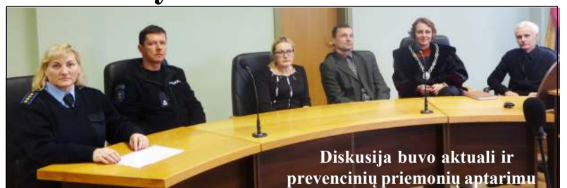
Diskusija buvo aktuali ir prevencinių priemonių aptarimu

mojo poveikio priemonę - dalyvavimą smurtinį elgesį keičiančiose programose bei jos vykdymą. Kalbėta ir apie artimiausiu metu probacijos skyriaus organizuojamą ir kartu su