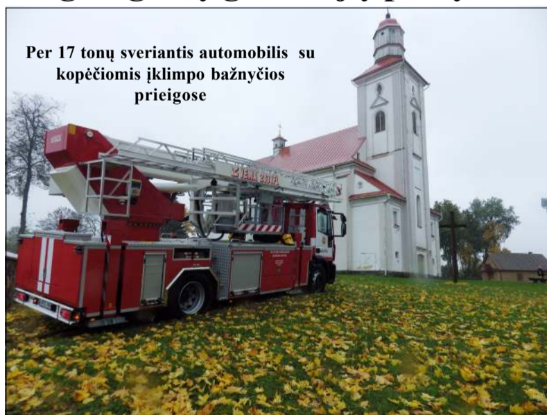
Per 17 tonų sveriantis automobilis su kopėčiomis įklimpo bažnyčios prieigose

Praėjusį penktadienį Videniškiuose, vykdydami akciją „Kūrenkime saugiai“, su gyventojais bendravo Molėtų priešgaisrinės gelbėjimo tarnybos