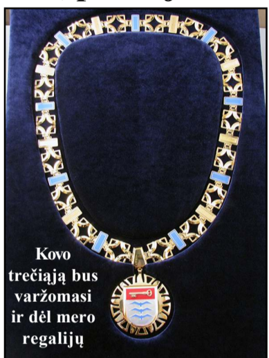
Kovo trečiąją bus varžomasi ir dėl mero regalijų

Kovo trečiąją, sekmadienį, rinksiu sau naują valdžią – savivaldos, artimiausią mums, mūsų gyvenimui. Kaip ir, beje, jau antrą kartą, tiesiogiai išsirinksiu rajono merą. Kaip jau esame informavę, mūsų gyventojų mažėjimas lemia ir rajono tarybos narių skaičiaus menkėjimą. Jei iki šiol daugelį metų rinkdavome 25 rajono tarybos narius, dabar jų lieka 21 – as. „Očko“ - ne vienas pa juokaus. Bet menki juokai, kai iš tiek daug teks rinktis tiek mažai. Svarbiausia, kad ne pagal išvaizdą ar pareigas turėsime rinktis, o pagal išmanymą, kompetencijas ir gebėjimą rinkėjui įteigti, kad tik jis gali mūsų kraštą vesti link gerovės, link geresnio gyvenimo būtent čia, Molėtuose.