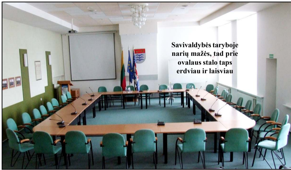
Savivaldybės taryboje narių mažės, tad prie ovalaus stalo taps erdviau ir laisviau

derio, sąrašė, kuriame optimalus 42 žmonių skaičius – daug ir nepartinių žmonių, prie jų prisijungusių verslo, kultūros bendruomenių atstovų, dirbančių ir pasirengusių toliau dirbti Molėtų kraštui. Kaip žinia, iki tol Molėtų konservatoriai, kad susirinktų daugumą rinkėjų balsų, gautų pakankamą jų palankumą, į rinkimų sąrašą gudriai įsirašydavo savivaldybės įstaigų vadovus, savivaldybės skyrių vedėjus, netgi seniūnus. Kaip žmogus už seniūną nebalsuos?