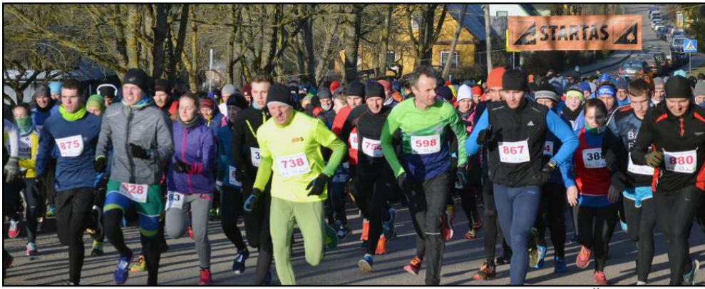
Tradiciškai šimtus bėgikų sutelks jau XXIX tradicinis bėgimas „Aplink Želvos ežerą“