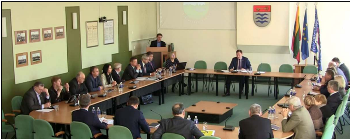
Šios kadencijos rajono taryba dar rinksis vasario pabaigoje, prieš pat savivaldos rinkimus