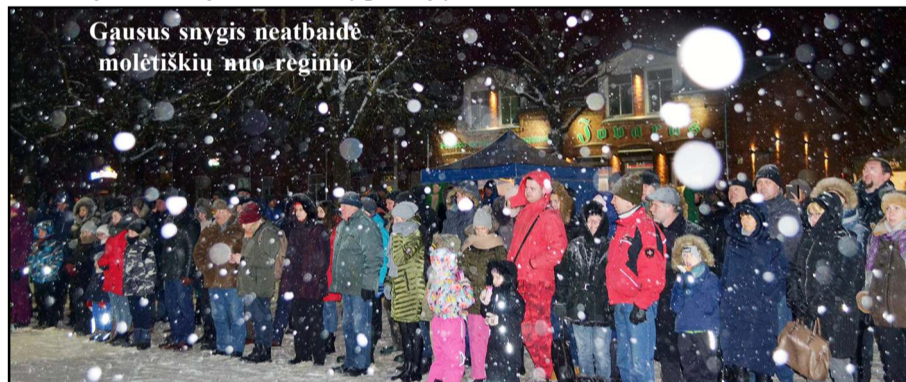
Gausus snygis neatbaidė molėtiškių nuo reginio