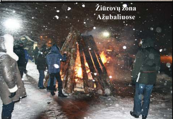
Žiūrovų zona Ažubaliuose