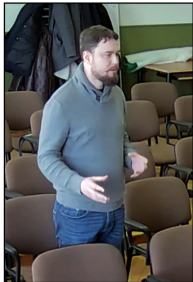
K. Varanka tarybai pristatė realią UAB „Armolė“ padėtį

už 847 ha tvenkinių žemės plotą turi sumokėti 7850 Eur, tačiau įmonės veikloje faktiškai naudojama tvenkinių žemės dalis yra mažesnė ir sudaro 522 ha. 40 procentų viso nuomojamo ploto, t.y. 325 ha įmonės veikloje nenaudojama, nes tvenkinių zonos yra užpelkėjusios dėl tvenkinių dumblių. Nenaudojamų tvenkinių būklė blogėja ir nenumatoma jų valymo galimybių. UAB „Armolė“ prašė proporcingai nenaudojamam žuvininkystės veikloje plotui 40 proc. sumažinti žemės