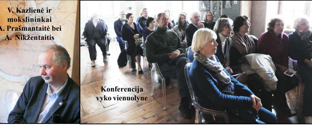
Konferencija vyko vienuolyne