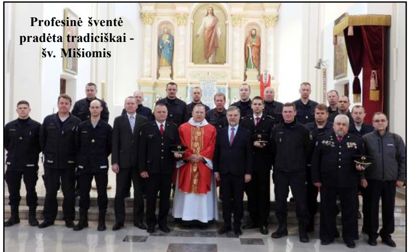
Profesinė šventė pradėta tradiciškai - šv. Mišiomis

Šventės proga buvo pagerbti nusipelnę ugniagesiai gelbėtojai, o trumpas bet jaukus sambūris su-