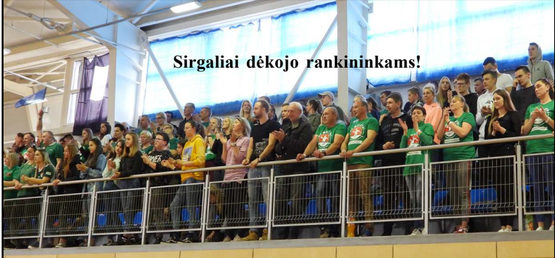
Sirgaliai dėkojo rankininkams!