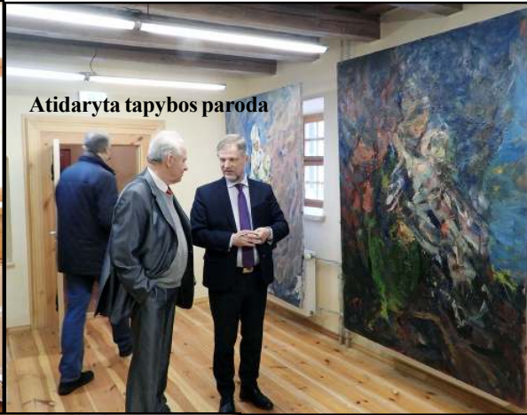
Atidaryta tapybos paroda