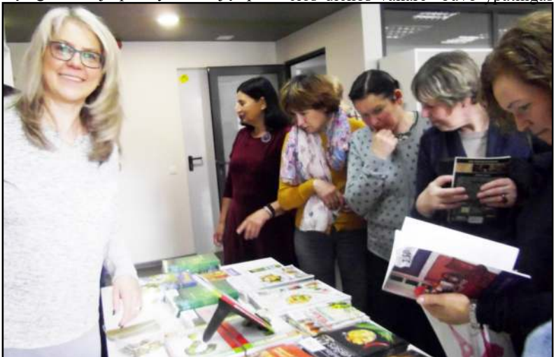
Knygų mugėje populiarumo ir skaitytojų sulaukė "Ūkininko" patarėjas