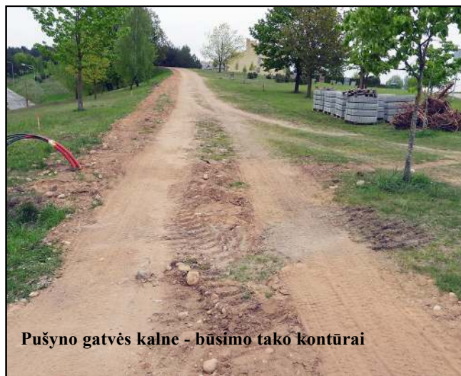
Pušyno gatvės kalne - būsimo tako kontūrai