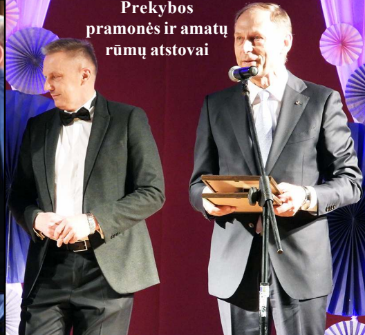
Prekybos pramonės ir amatų rūmų atstovai