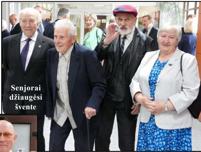
Senjorai džiaugėsi švente

dų išnaudojimas, dalyvavimas juose, pakliuvimas, kad galėtume rašyti paraišką ir laimėti – pasiekimai, kurie padeda išgyventi. O su Anykščių mokykla mums teko labai glaudžiai bendrauti, nors šiandien esu truputį sunerimęs dėl didelės bazės, nemenkų apimčių. Bet viliamės, kad su Seimo ir Švietimo ir mokslo ministerijos pagalba, padedant savivaldybės merui, įvertinę visus sver-