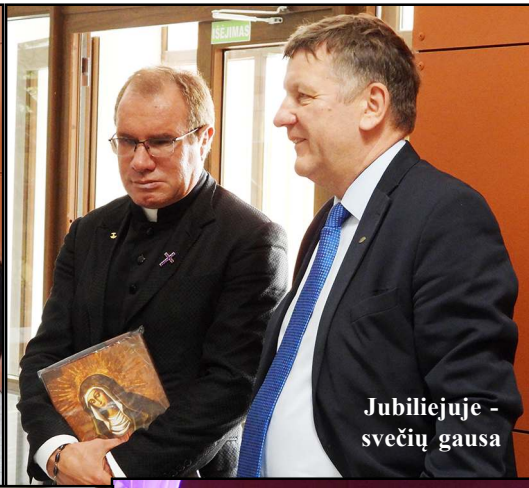
Jubiliejuje - svečių gausa