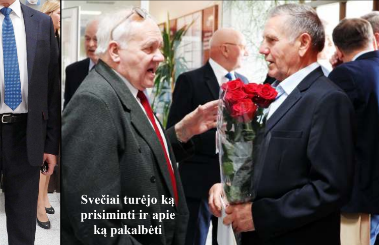
Svečiai turėjo ką prisiminti ir apie ką pakalbėti