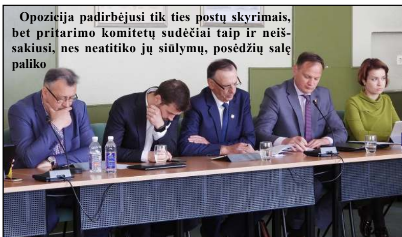
Opozicija padirbėjusi tik ties postų skyrimais, bet pritarimo komitetų sudėčiai taip ir neišsakiusi, nes neatitiko jų siūlymų, posėdžių salę paliko

radosi „bangų“. Mat opozicijai, kuria dar praėjusį mėnesį įvykusiame pirmajame posėdyje pasiskelbė į tarybą patekusieji šeši komiteto „Molėtai kartu“ nariai, tapo akivaizdu, kad posėdyje galimi nagrinėti tik keli „organizaciniai“ klausimai – dėl mero pavaduotojo, administracijos direktoriaus teikimo ir skyrimo, komitetų sudarymo ir pan. Kitų darbinį klausimų darbotvarkėje būti negali, nes nebuvo sudaryti komitetai, kuriuose privalu svarstyti pateiktą tarybos tvirtinimui sprendimų projektus. Susirinkusiems tarybos na-