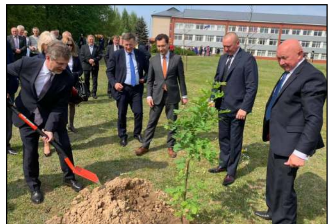
Alantos seniūnijos gyventojų bendruomenė mokyklai padovanojo ažuoliuką, kuris netrukus buvo pasodintas mokyklos parke.

nų iš Anykščių dovana – šūviai iš senovinės patrankos, kuriuos į netoliese žaliuojantį mišką nutaikė patrankos rėmo autorius tautodailininkas