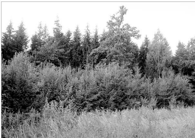
Pagal veiklos sritį „Miško veisimas“ skiriama parama – vertinga paspirtis ketinantiems įvesti mišką.

Parama neteikiama, jeigu sodinami trumpo rotacijos želdiniai (kirtimų rotacijos trukmė – iki 15 metų), Kalėdų eglutės ir greitai augančių rūšių medžiai, skirti energijai gaminti. Želdinant greitai