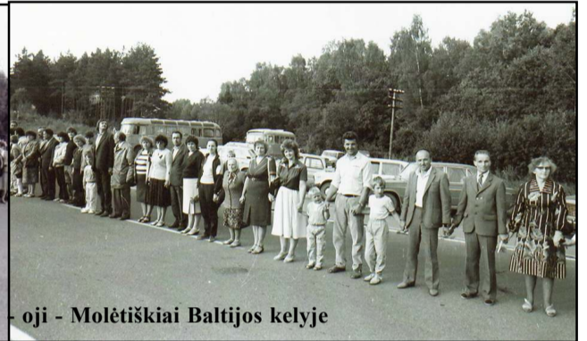
1989 rugpjūčio 23 - oji - Molėtiškiai Baltijos kelyje

Po 30 metų grįžtame į savo Baltijos kelią, nuvalome bėgančio laiko dulkes nuo savo tomis dienomis pastatyto kryžiaus Vilniaus- Panevėžio automagistralės 55 kilometre, vėl susirenkame pabūti ir prisiminti, patirti gyvos žmonių grandinės dvasinę