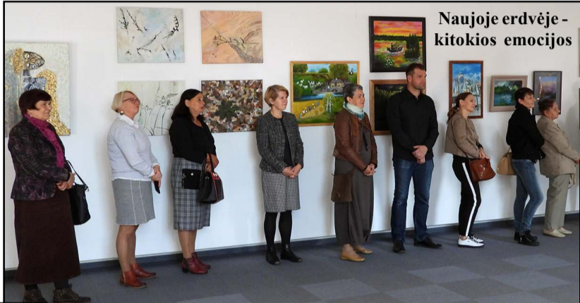
Naujoje erdvėje - kitokios emocijos

Molėtų rajono dailės ir fotografijos premijos parodos konkurso atidarymą po sesių Linos Dieninės ir Rūtos Ve-