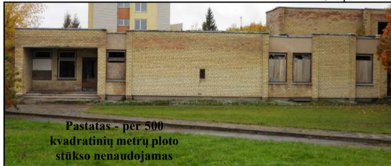
Pastatas - per 500 kvadratinį metrų plotą stūkso nenaudojamas