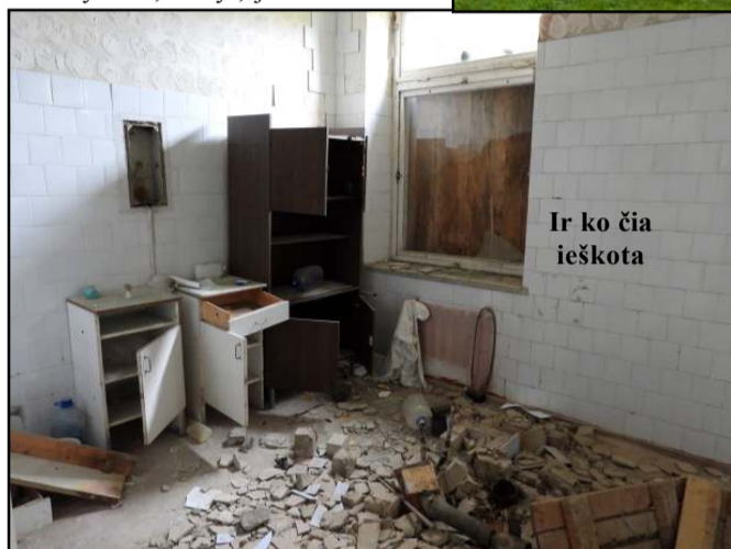
Ir ko čia ieškota