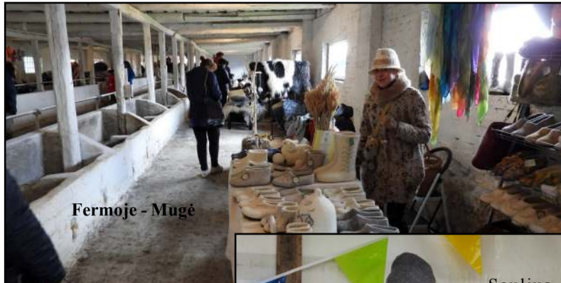
Fermoje - Mugė

-Šiemet pakvietus svečius iš Latvijos ir Estijos, norėjome, kad šventė taptų ir problemų sprendimu, nes avininkystė išgyvena ne pačius geriausius laikus, problemų susikauptė daug. Lietuvoje turime 37 avių veisles, šalyje iš viso registruota 187 tūkstančiai avių. Prieš dvejus metus jų buvo 195 tūkstančiai. Avių skaičius mažėja dėl atsiradusių problemų - dėl mėsos, vilnos,