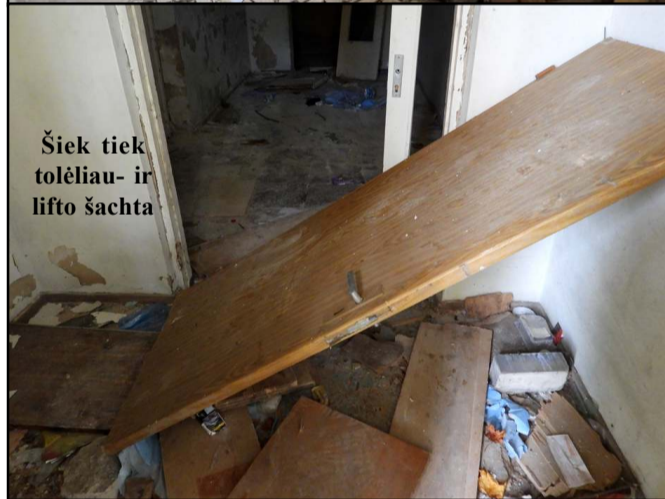
Šiek tiek toliau - ir lifto šachta