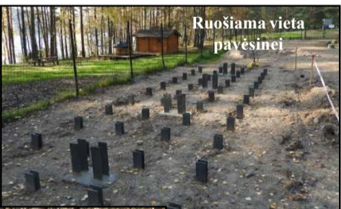
Ruošiama vieta pavėsinei

tos būsimos infrastruktūros pėdsakus... Rangovas - Žiuko įmonė - darbus pradėjo nuo pačių įspūdingiausių elementų - laiptų ir pontoninio liepto įrengimo. Šie darbai beveik pabaigti