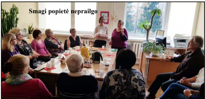
Smagi popietė neprailgo