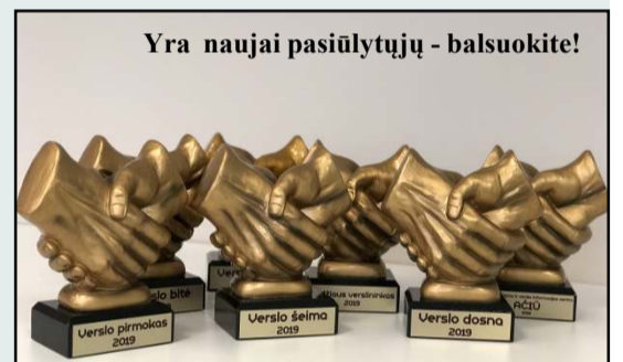
Yra naujai pasiūlytųjų - balsuokite!