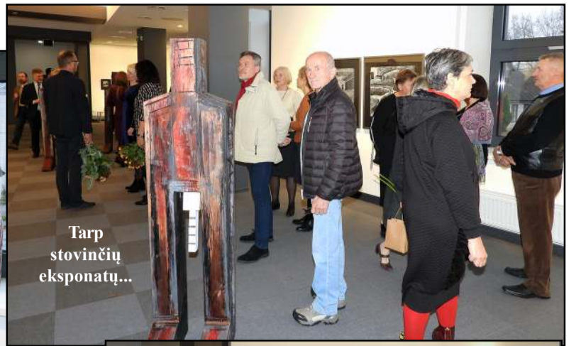
Tarp stovinių eksponatų...

ne inspirovo kadais daryti studentiški eskizai, kuriuos labai norėjosi paleisti. Mano darbus valdo lėlių teatras, kuriose jos tragiškos, beje, kaip ir