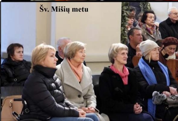
Šv. Mišių metu