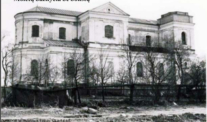
Molėtų bažnyčia be bokštų

statusas, tvarkant jos fasadus, turi būti parengtas lauko sienų tvarkybos projektas,“ - pabrėžė paveldosaugininkė N. Stalnionienė.