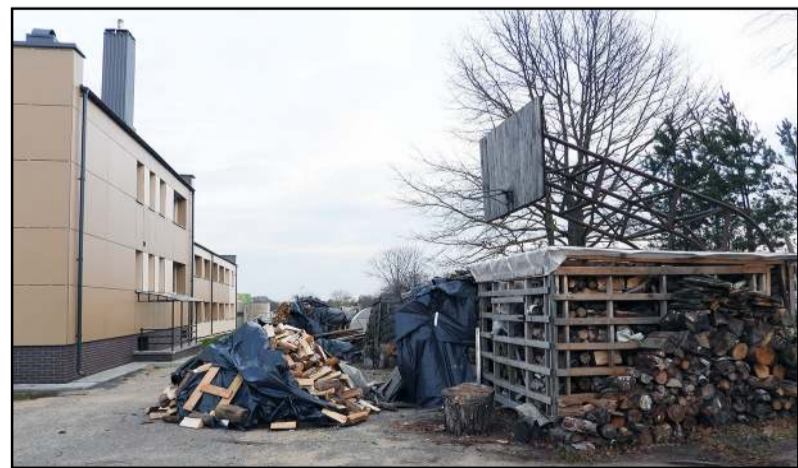
Gražaus, renovuoto daugiabučio kieme - malkinės ir malkų krūvos

Į „Vilnius“ redakciją paskambinusi Obelių 1A numeriu pažymėto daugiabučio namo Molėtuose gyventoja išdėstė problemą. Pasak gyventojos, renovuoto daugiabučio namo gyventojai dar prieš jo atnaujinimą išreiškė norą prisijungti prie centralizuotų šilumos tinklų. Buvo surinkti parašai ir, kaip sakė moteris, perduoti UAB „Molėtų švara“. Gyventojai