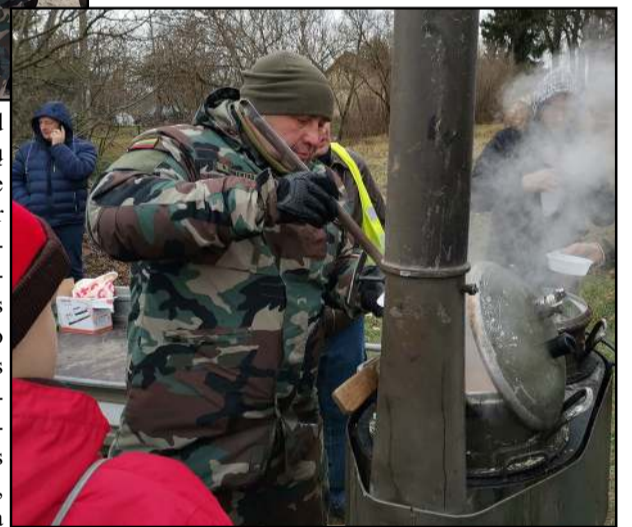
Minėjimo pabaigoje - žvėrienos sriuba