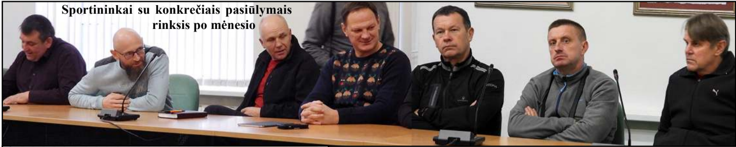
Sportininkai su konkrečiais pasiūlymais rinksis po mėnesio