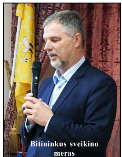
Bitininkus sveikino meras

40 - mečio jubiliejų šeštadienį tradicinėje šventėje "Bitininkų spiečius" šventė Molėtų rajono bitininkų draugija. Šventę pirmą kartą organizavęs naujasis jos pirmininkas