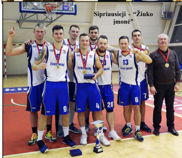
Sipriausieji - „Žiuko įmonė“