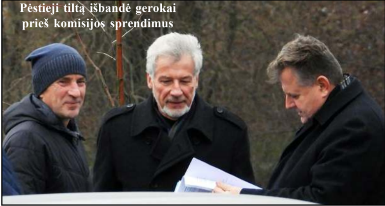
Pėstieji tiltą išbandė gerokai prieš komisijos sprendimus

čiųjų pradėtas bandyti, praėjusią savaitę sulaukė komisijos, kuri vertino atliktus darbus. Tam, kad būtų