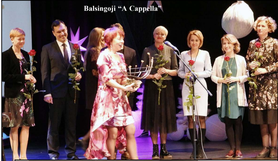
Balsingoji „A Cappella“