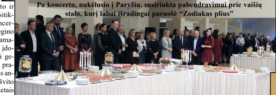
Po koncerto, nukėlusio į Paryžių, susirinkta pabendravimui prie vaišių stalo, kurį labai išradingai paruošė „Zodiakas plus“