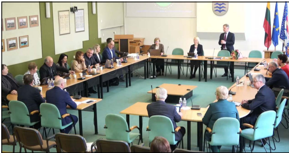
Tarybos posėdis pradėtas sveikinimais jubiliejaus proga

Pradėjus nuo rajono strateginio veiklos plano 2023 – 2025 metams patvirtinimo, trumpo jo pristatymo ėmėsi meras, sakęs, jog plane numa-