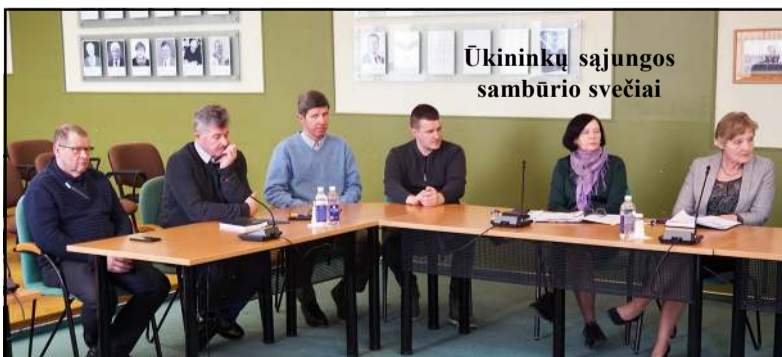
Ūkininkų sąjungos sambūrio svečiai

Praėjusių savaitę į ataskaitinį sambūrį rinkosi rajono ūkininkų sąjungos nariai. Tiesa, sąjunga, kurios veikloje prieš keletą metų būta pertraukos dėl vadovų kaitos, vienija tik 26 narius, nors rajone ūkininkų yra 3000. Tad dabar jau vis aktyviau veikiančios sąjungos pirmininkė Si-