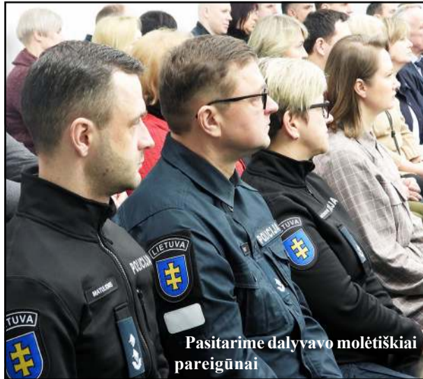
Pasitarime dalyvavo molėtiškiai pareigūnai