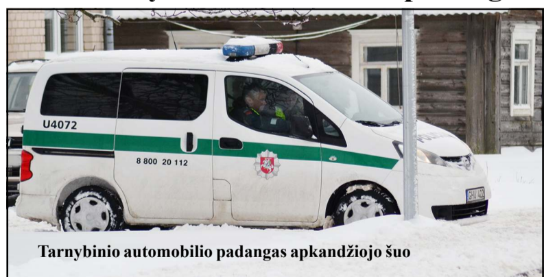
Tarnybinio automobilio padangas apkandžiojo šuo

Praėjusios savaitės pradžia policijos įvykių suvestinėse paženklinta nelaimėmis – gaisru Ambraziškių kaime, kuriame žuvo žmogus. Tą pačią dieną pranešta apie rastą mirusį žveją ant Galuonų ežero ledo... Skaudžiomis nelaimėmis prasidėjusią savaitę pareigūnų pagalbos reikėjo 49 kartus. Tiesa, būta atvejų, kai į pranešimus reaguavo ne tik policininkai, bet ir medikai, ugniagesiai gelbėtojai... Kaip žinia, pareigūnams, reaguojant į įvykius, prireikia pačių įvairiausių kompetencijų, taip pat - gyvenimiškos patirties, kaip ir vykus pagal iškvietimą į vieną Molėtų rajono parduotuvę, kurioje teko įvertinti ir ten parduodamus maisto produktus. Mat anonimas pranešė, kad parduotuvėje pardavėja prekiauja mėsos gaminiams, atneštais pašalinių žmonių. Pareigūnai apžiūrėjo mėsos gaminius, kurie visi buvo tinkamai paženklinti gamintojo pakuotėmis bei pažeidimų nefiksavo. Kelis kartus vykta prie Molėtų gimnazijos į Jaunimo gatvę, kur, atitverus statyb-