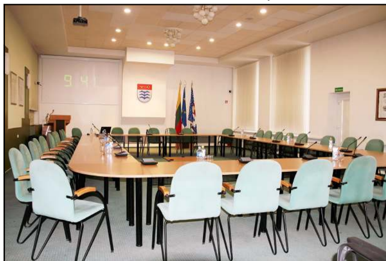
Kaip ir kas šioje salėje susidėlios, matysime per artimiausias keletą savaitių, o pirmasis posėdis vyks balandžio pabaigoje

P.s. Pirmasis naujosios kadencijos tarybos posėdis, kuriame ir prisieks politikai, turėtų įvykti ne anksčiau nei balandžio 24 dieną, nes dabartinės kadencijos įgaliojimai baigiasi balandžio 23 -ąją, tuomet, kai jie prisieks dirbti Molėtų kraštui.