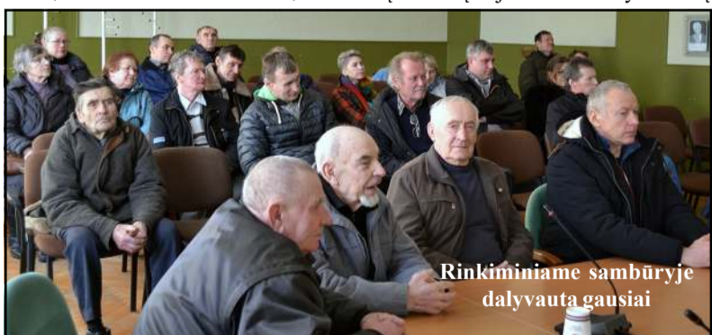
Rinkiminiame sambūryje dalyvauta gausiai

rinkta draugėn praėjusį savaitgalį, nes draugija be pirmininko ilgai būti negali. Sambūryje rinktas naujas pirmininkas, draugijos valdyba, revizorius, aptarti kiti klausimai. Į Molėtų rajono savivaldybės salę