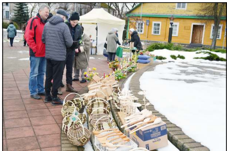
Būta įvairių darbėlių, pintinių, inkilėlių, verbų, domėtasi kanapių produkcija

valandas skambėjusi muzika nutiekė puikiai, o šventės dalyviai - Molėtų krašto žmonių su negalia sąjungos rankdarbininkai siūlė įsigyti įvairių darbėlių, būta ir pintinių,