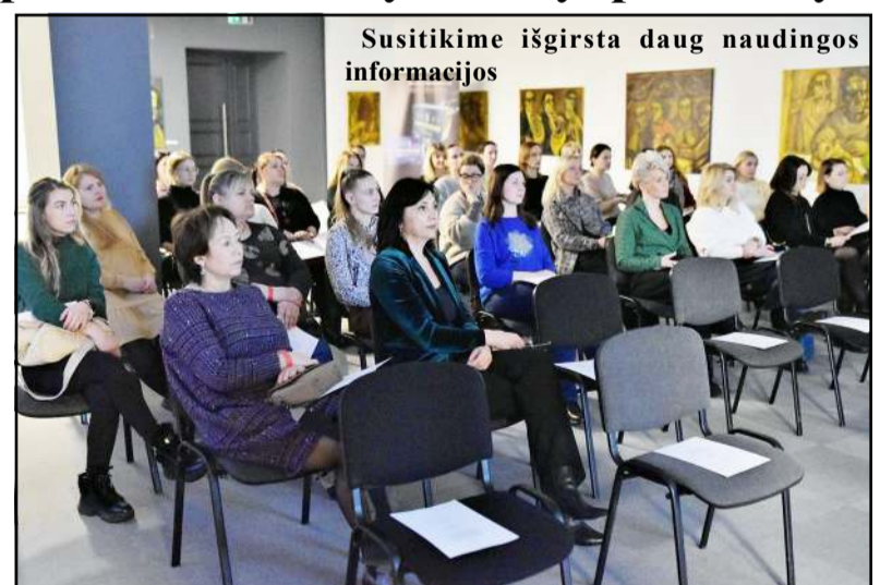
Susitikime išgirsta daug naudingos informacijos