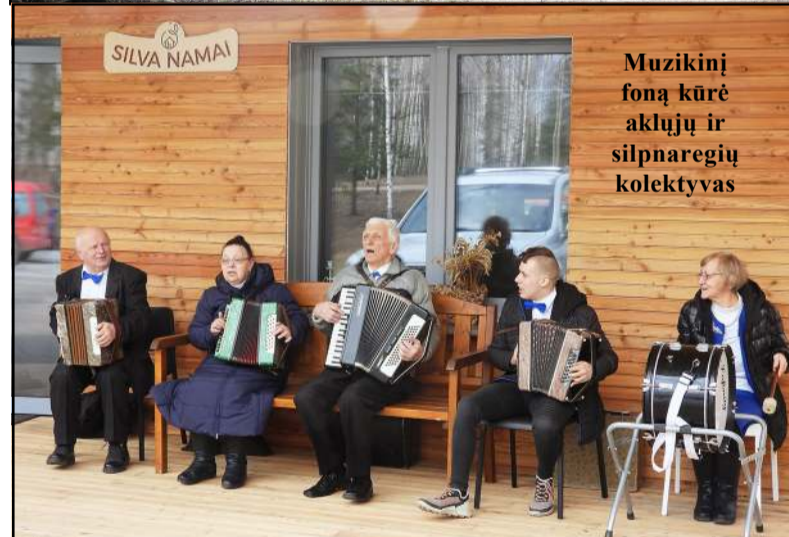
Muzikinį foną kūrė aklųjų ir silpnaregių kolektyvas