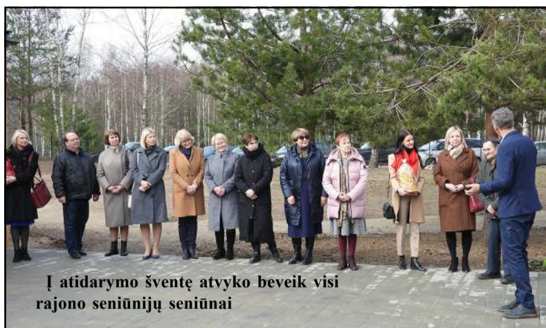
Į atidarymo šventę atvyko beveik visi rajono seniūnijų seniūnai

turientai rinkosi geografijos valstybinį egzaminą, po 11 – a fizikos, chemijos ir informacinių technologijų egzaminus, 2- rusų kalbos egzaminą. Brandos atestatui gauti reikia išlaikyti 2 brandos egzaminus – privalomą lietuvių kalbos ir literatūros (valstybinį ar mokyklinį) bei vieną pasirinkto dalyko egzaminą – arba atlikti brandos darbą. Iš viso abiturientai gali rinktis ne daugiau kaip 7 brandos egzaminus. „Vilnius“ informacija