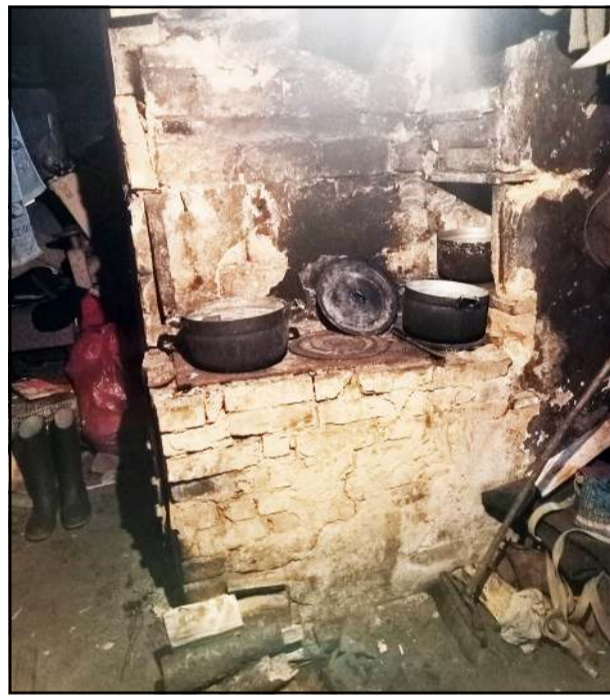
Tokia tvarka - žingsnis link didelės nelaimės, kuri gali baigtis ir tragiškai

Nei elektros instaliacijos, nei pačių žmonių gyvenimo būdo, kai nenori-