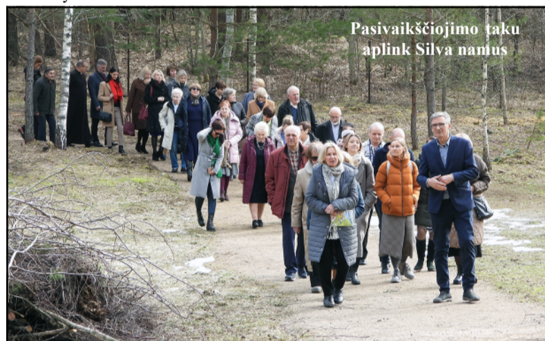
Pasivaikščiojimo takas aplink Silva namus