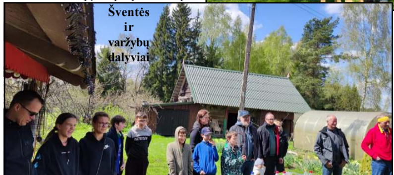
Šventės ir varžybų dalyviai