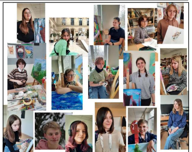
Molėtų dailės galerijoje gegužės 14 d. 16 val. vyks graži šventė - paroda - Menų mokyklos dailės skyriaus baigiamųjų darbų paroda