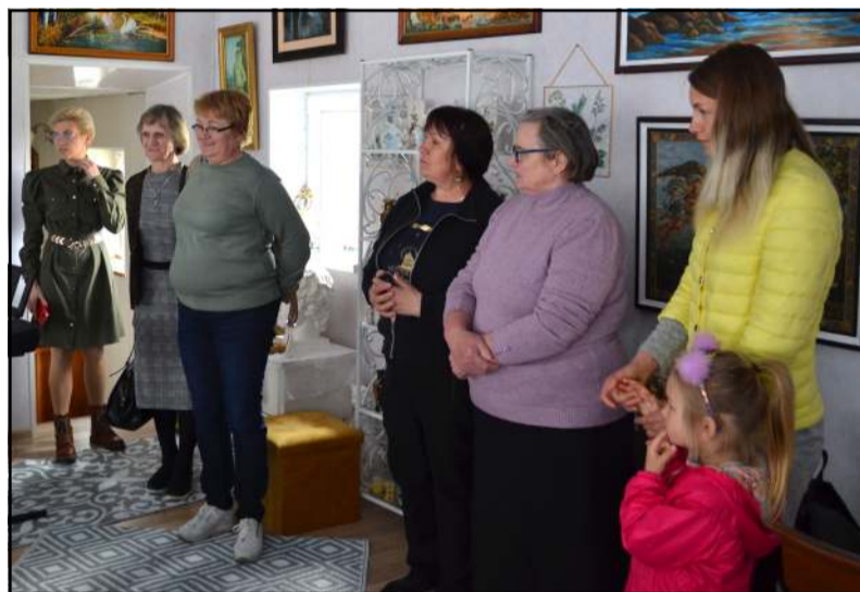
Į svečius suskubo artimiausi bendrijos draugai, nariai ir bičiuliai

sukako 27-eri metai. Dabar bendrijoje 54 gausios šeimos ir 17 vienišų mamų. O Svetlana šiemet mini 25-erių metų vadovavimo bendrijai su-