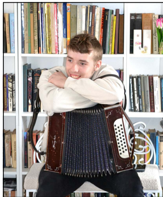
Oskaras dovanojo savo kūrybos dainas