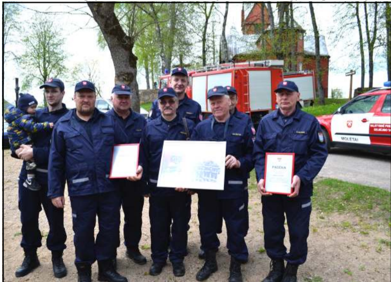
Šventės šeiminkai - Skudutiškio ugniagesių komanda

"Šiais automobiliais taip pat prisidėsime prie rajono ir visos šalies ekologijos, neteršime aplinkos, suteiksime privilegijų vairuotojams, sumažinsime važiavimo laiką" - deklaruoja savivaldybės administracija.